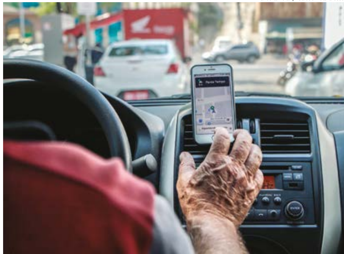
Grupo tenta derrubar cobrança e não descarta mobilização para enfrentar a Prefeitura