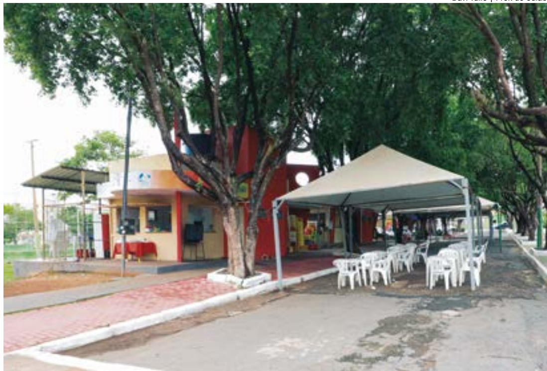
A licitação ocorrerá por meio da modalidade pregão eletrônico, onde a negociação ocorre somente pela internet