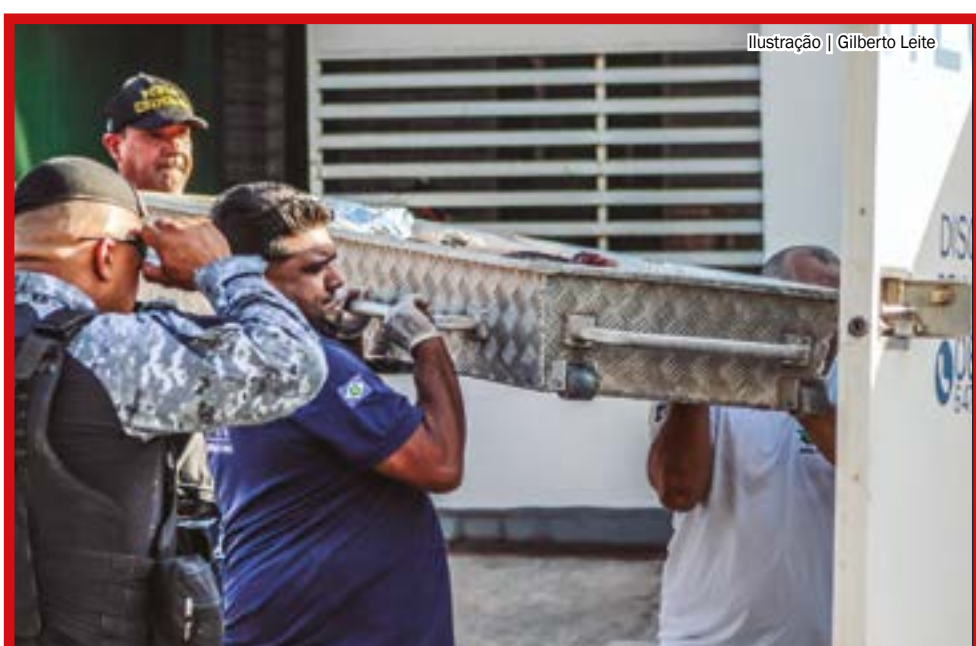
Ilustração | Gilberto Leite

FACÇÃO ARMA EMBOSCADA, SEQUESTRA E EXECUTA JOVEM EM SORRISO