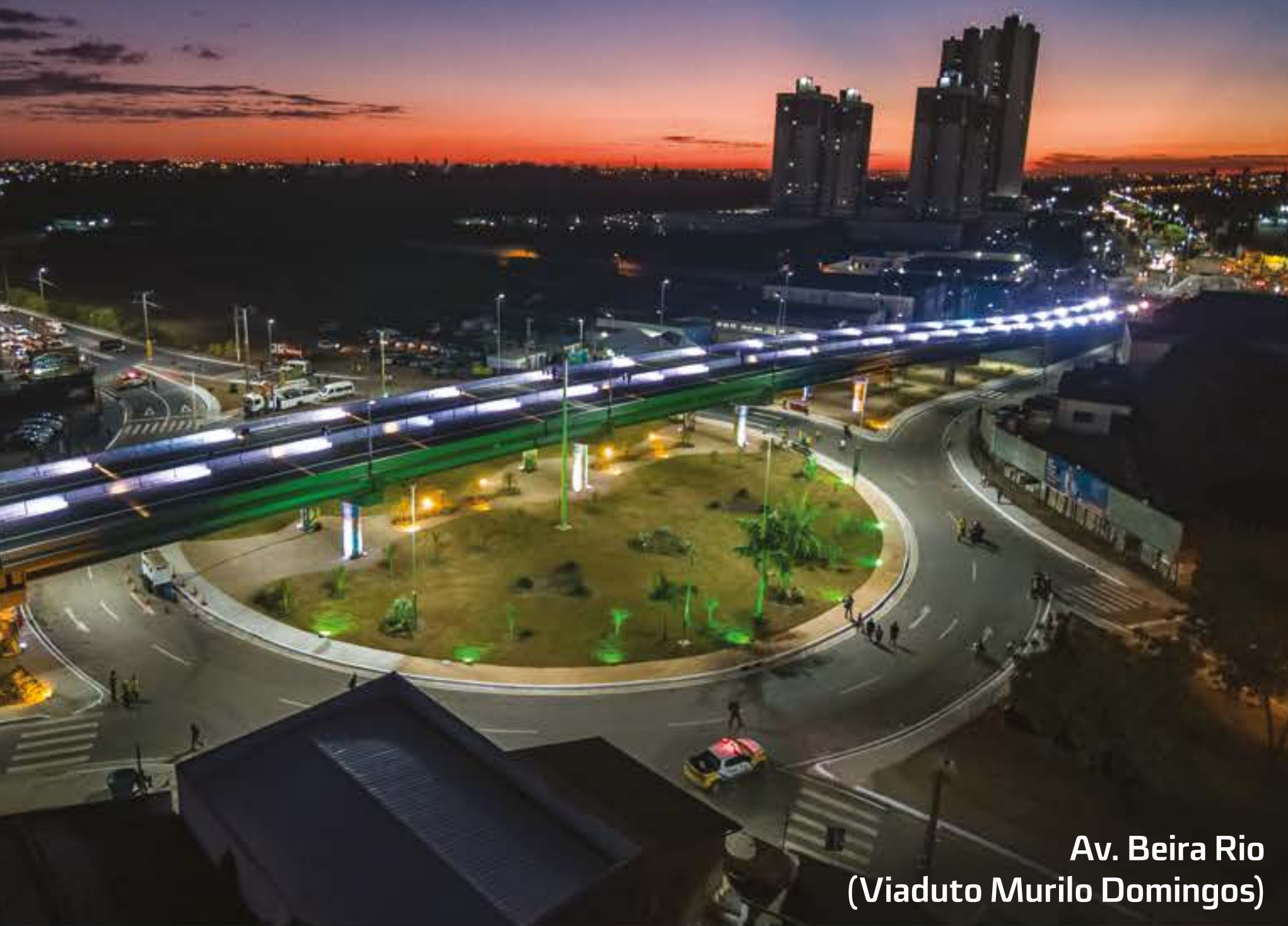
Av. Beira Rio (Viaduto Murilo Domingos)

Viadutos foram construídos, garantindo segurança e conforto aos motoristas.