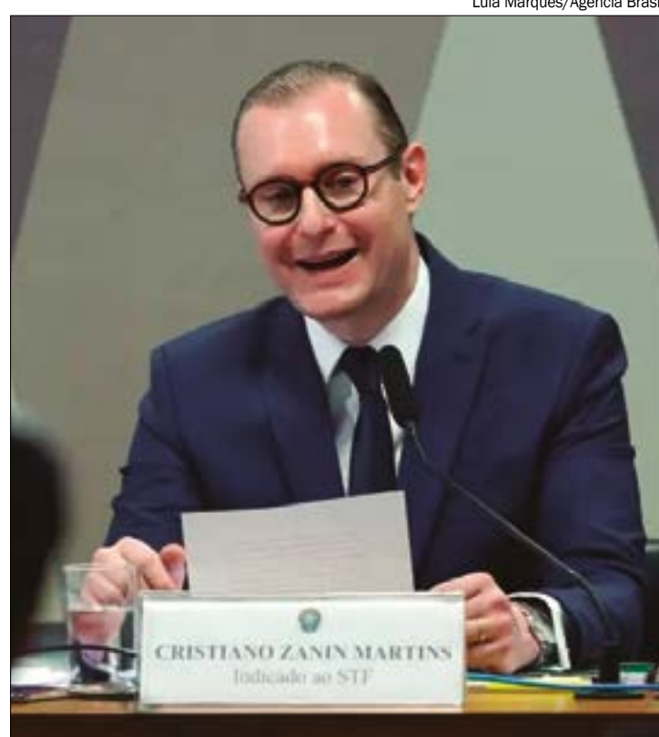
Cristiano Zanin suspendeu as novas convocações para PM e Bombeiros, em ação que contesta cota de gênero nos concursos

"Garantindo-se às candidatas mulheres aprova-