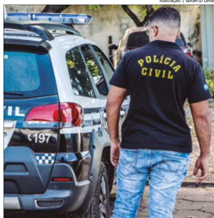
Ilustração | Gilberto Leite