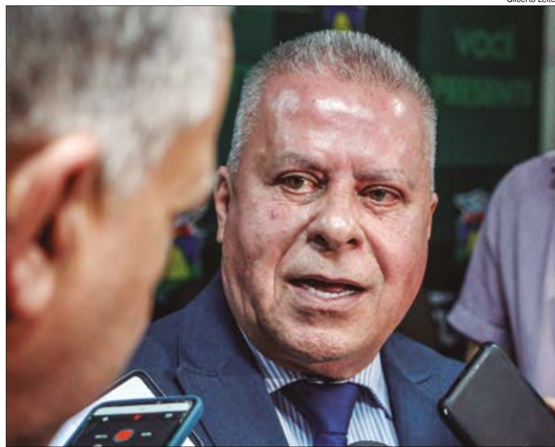
Chico 2000 defendeu a constitucionalidade do projeto, já que aumento valerá apenas para a próxima legislatura

"No início de 2023 foi aprovada a instituição da Verba indenizatória a servidores do Poder Le-