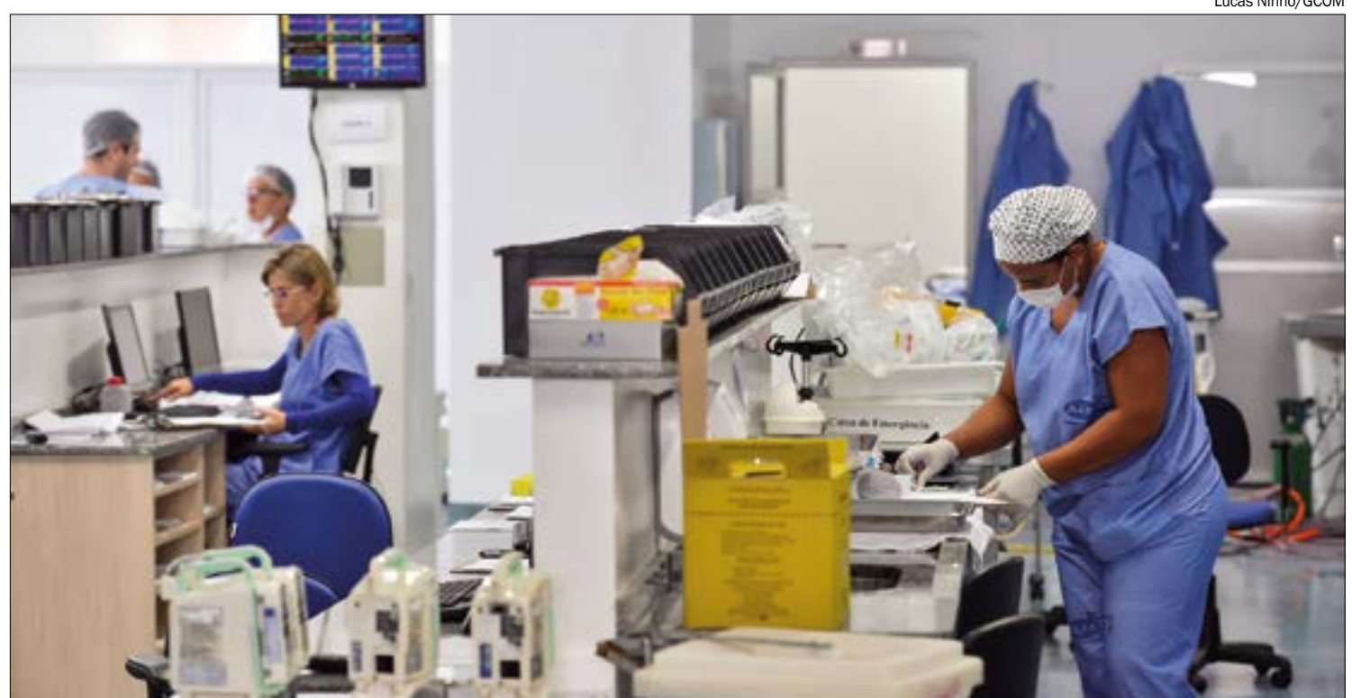
Estado planeja entregar 94 UTIs até o dia 20 de julho e custear a abertura de outras 159, mas faltam profissionais para operá-las

Por não conseguir lograr êxito na contratação, o governo aumentou a oferta para atrair profissionais da Saúde. O Estado pretende contratar 50 médicos e mais de 300 enfermeiros para reforçar o SUS.