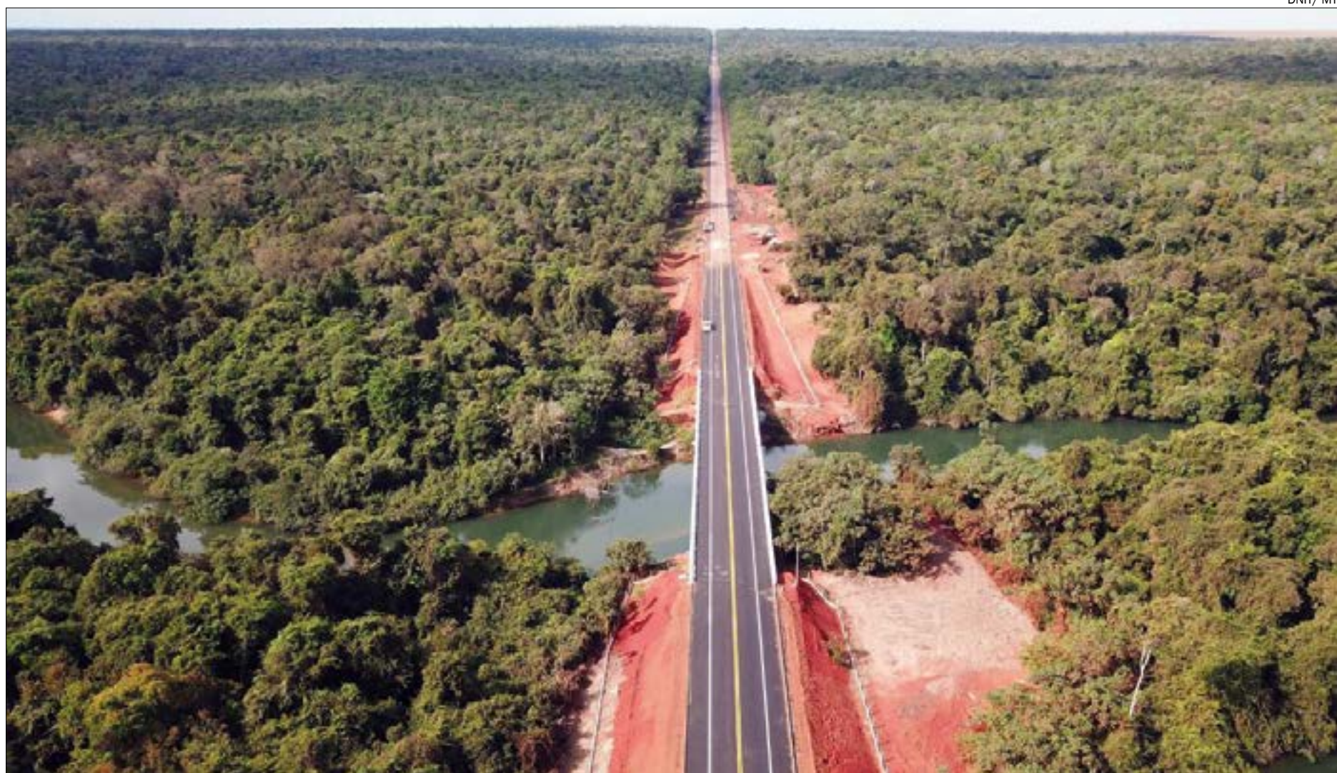
Além da conclusão das oito pontes, o Dnit já pavimentou 150 quilômetros da rodovia