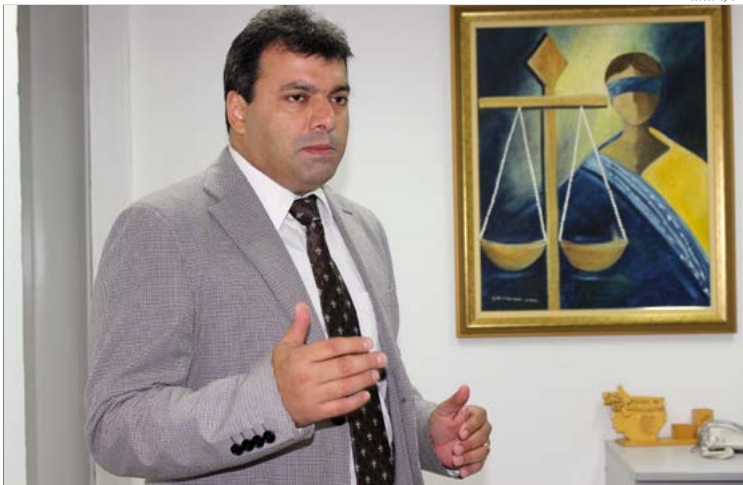
Juiz explica que contágio na PCE pode atingir policiais e gerar reflexos nos bairros de Cuiabá e Várzea Grande

“Assim, caso um energético protocolo de aten-