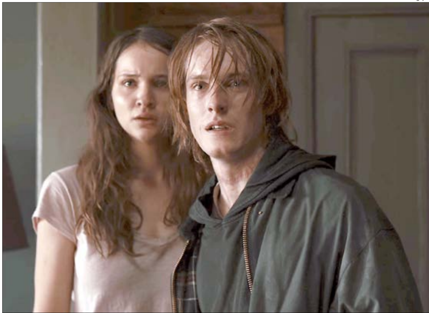
Originalidade do enredo fez Dark ser eleita a 'melhor série da Netflix', com 2,5 milhões de votos

Agora, a terceira temporada prometeu entregar o fim (ou seria o começo?) de todo o emaranhado criado anterior-