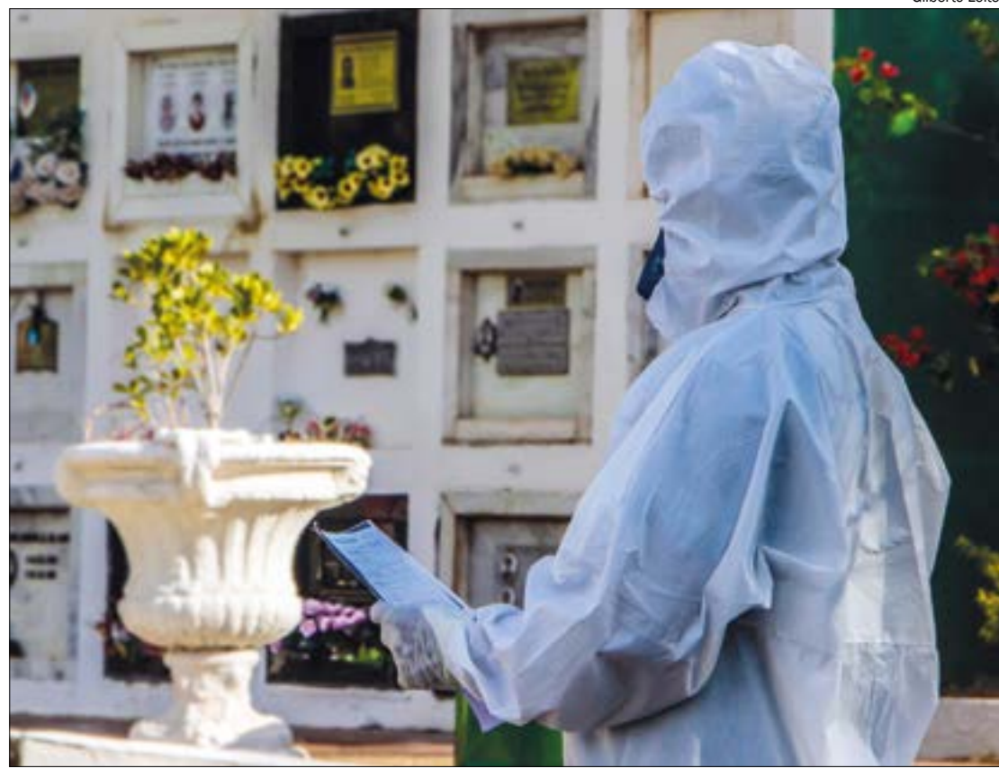
Em Cuiabá, que concentra o maior número de casos da covid-19, 206 pessoas já morreram por causa do vírus

Os municípios classificados como de risco ‘muito alto’ devem adotar a “quarentena coletiva obrigatória”, o famoso ‘lockdown’, por 15 dias. Além disso, é preciso fazer barreiras sanitárias para controle de entrada e saída do município, mantendo apenas os serviços e atividades essenciais.