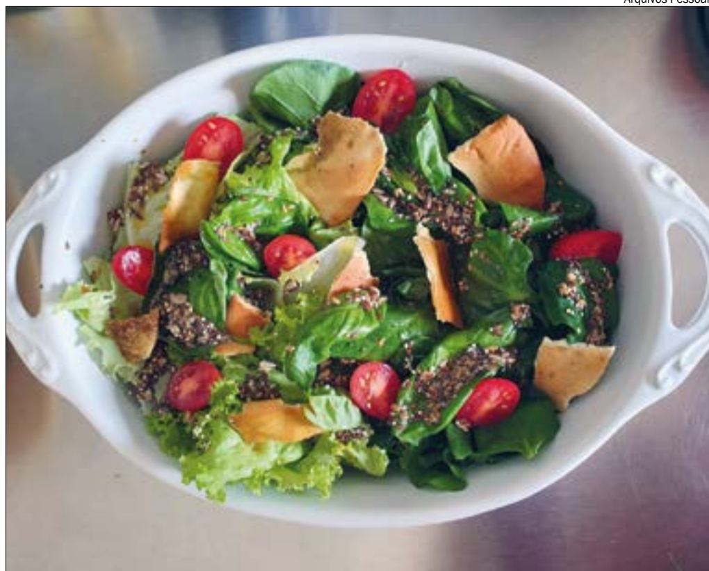
Adriana dá dica de salada com mix de folhas e crocante de pão sírio bem refrescante e saborosa para toda a família

Além disso, preparar o alimento também se tornou uma atividade que envolve a família toda. Muitas famílias estão indo literalmente para a cozi-