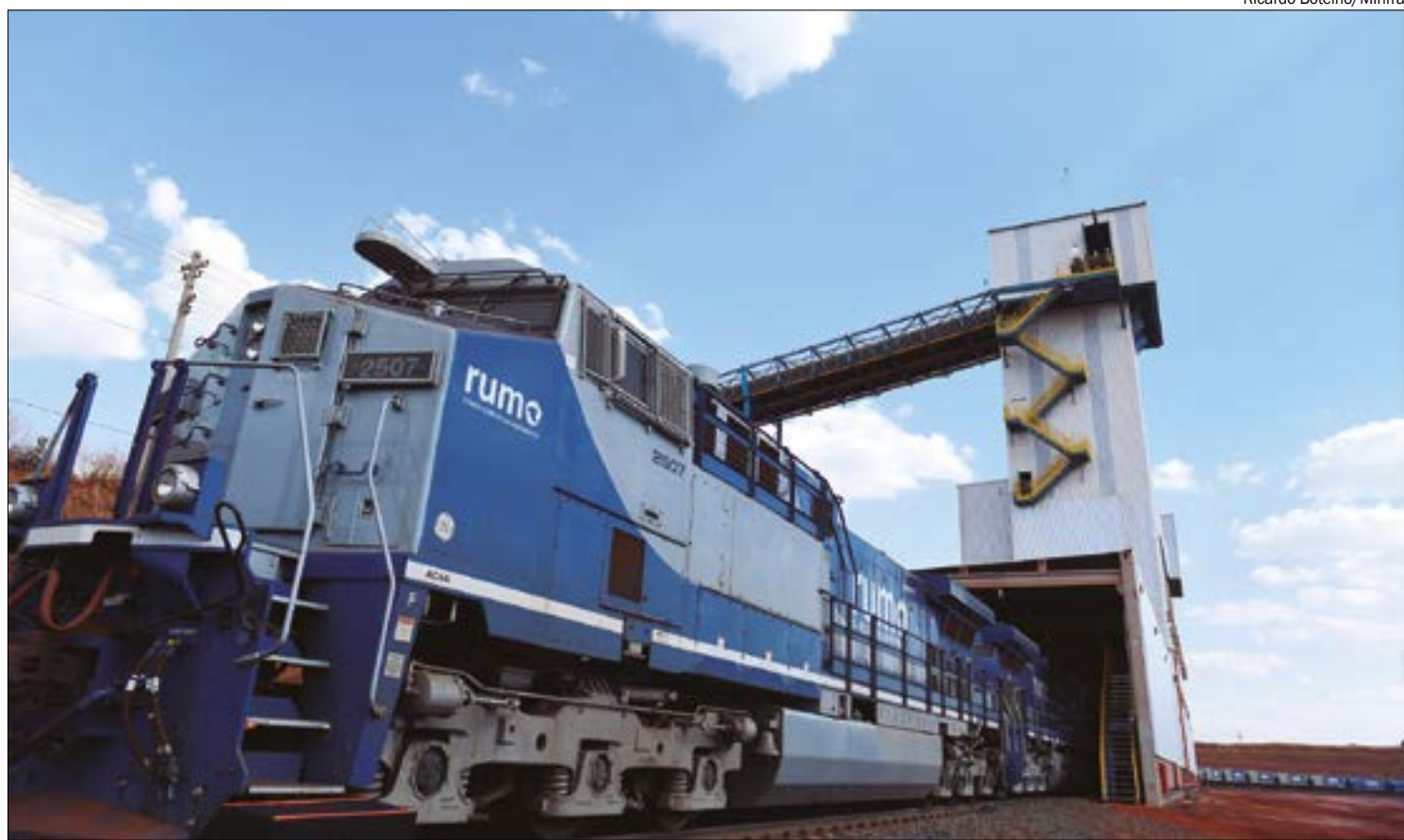
Novo traçado da ferrovia deve passar a 40 metros de bairros residenciais, o que causou uma insurgência no município

Além dos riscos trazidos pelo novo traçado da ferrovia, o deputado estadual Thiago Silva (MDB) aponta