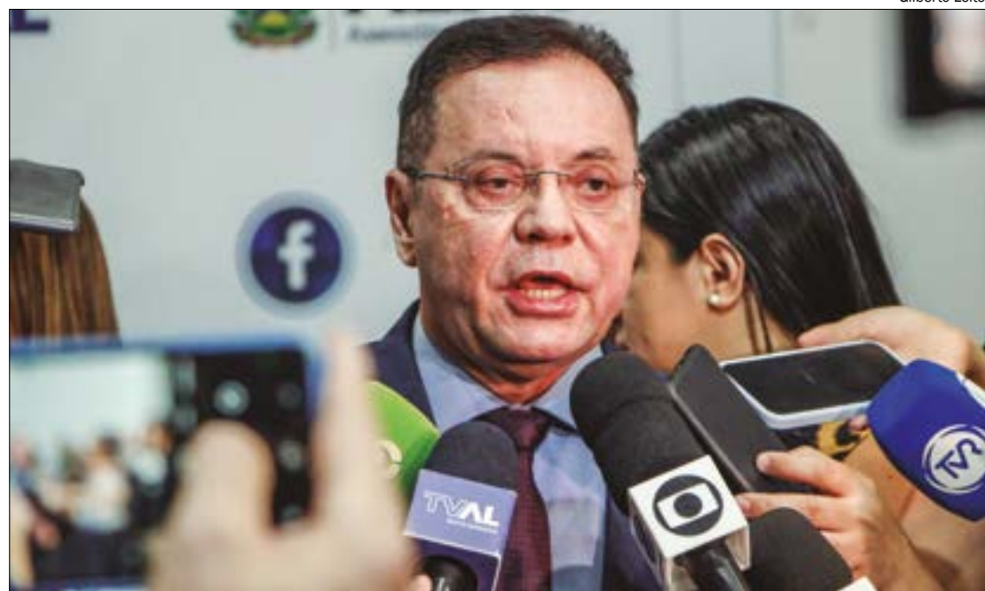
Botelho aponta risco com tráfego pesado na MT-251 e cobra fiscalização da Polícia Militar