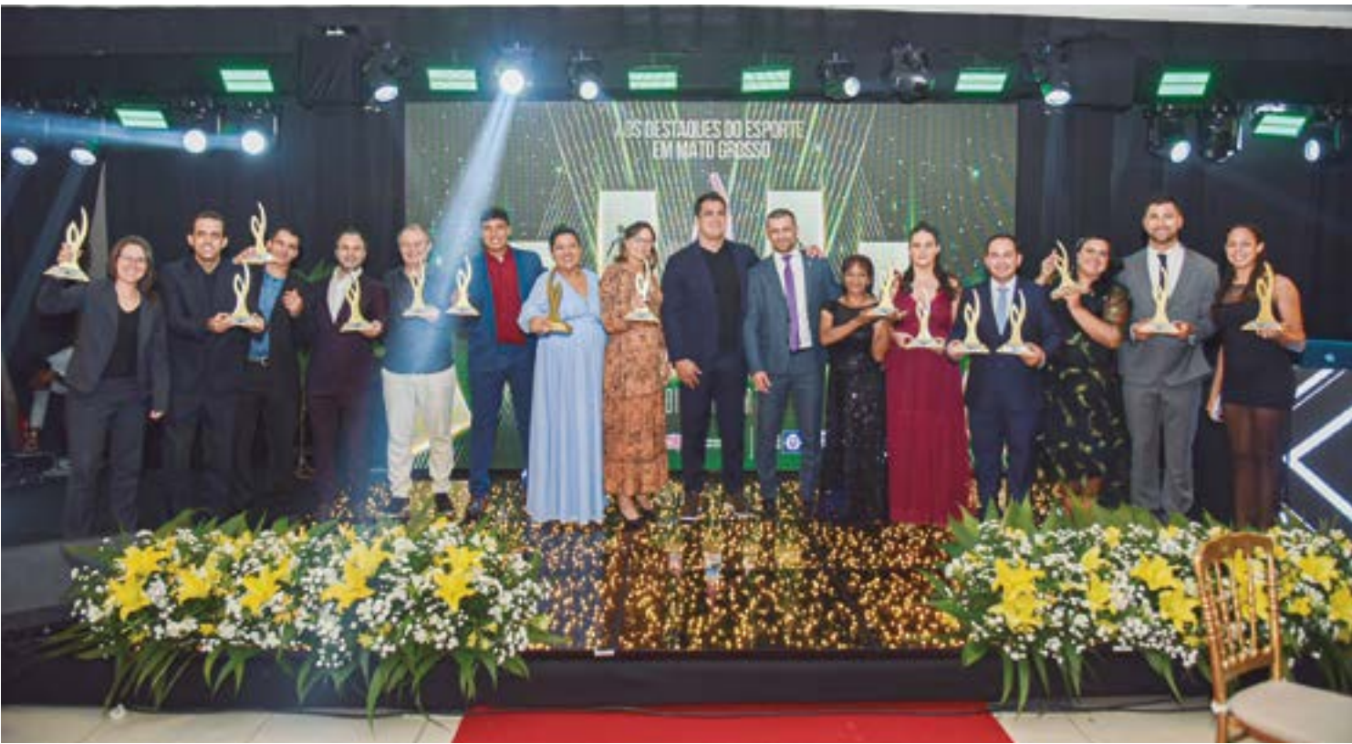
Ao todo, 37 esportistas, treinadores, jornalistas e apoiadores de todo estado participaram da cerimônia