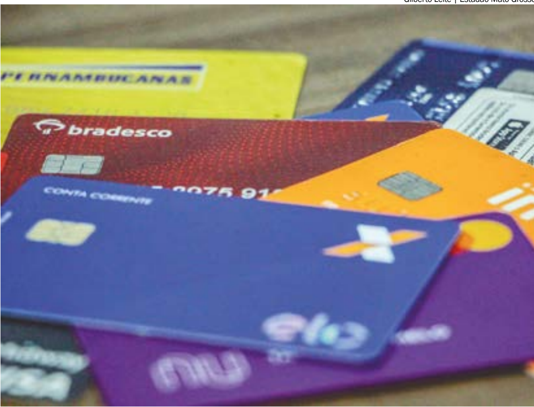
O cartão de crédito continua sendo a principal forma de dívida, citado por 81,9% dos entrevistados

se 1 ponto percentual em relação ao mês anterior, e o crédito consignado, com 4,5%. Outros tipos de dívidas variam entre 0,5% e 4,3%, este último relacionado ao financiamento de imóveis. DADOS NACIONAIS - No cenário nacional, a pesquisa revela que 76,6% das famílias brasileiras estão endividadas, uma queda de 0,3 ponto percentual em comparação com novembro. Aqueles com contas em atraso também diminuíram, alcançando 29%, o menor patamar desde junho de 2022. O cartão de crédito continua sendo a principal forma de dívida, mencionado por 87,7% dos entrevistados, seguido pelo crédito consignado e financiamento imobiliário, com avanços mensais de 5,4% e 8%, respectivamente.