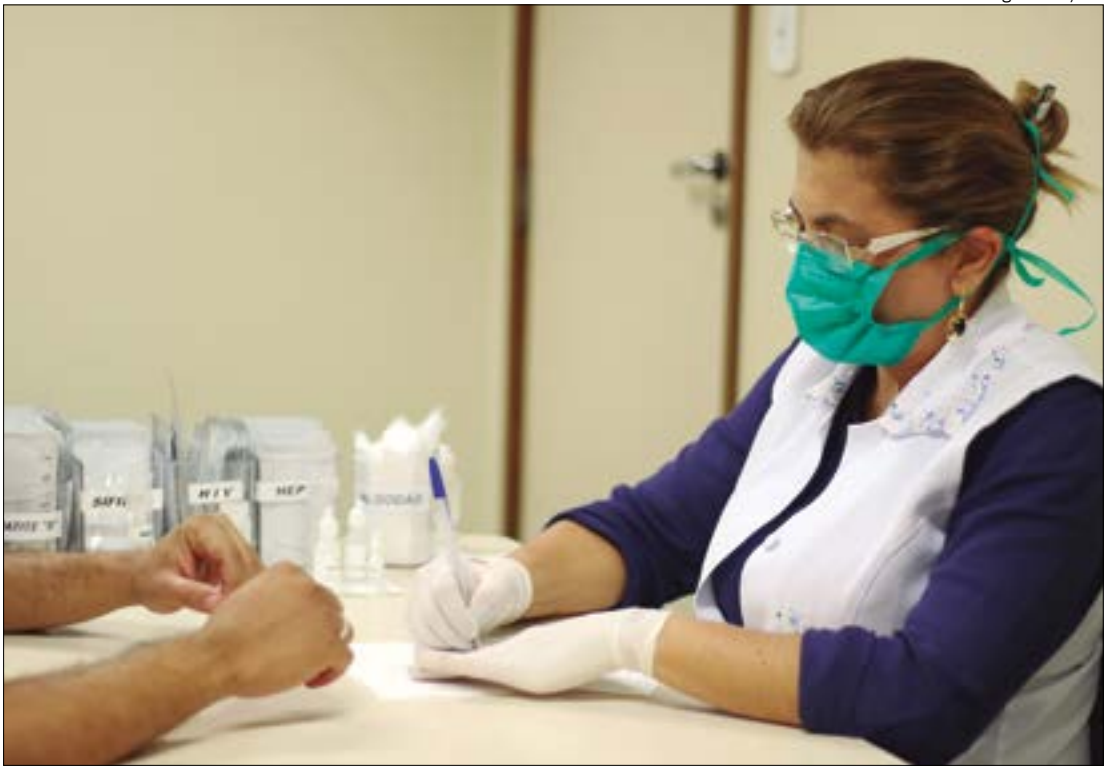
Autoridades em Saúde alertam que o abandono do cuidado pode agravar o quadro clínico e até evoluir para óbito