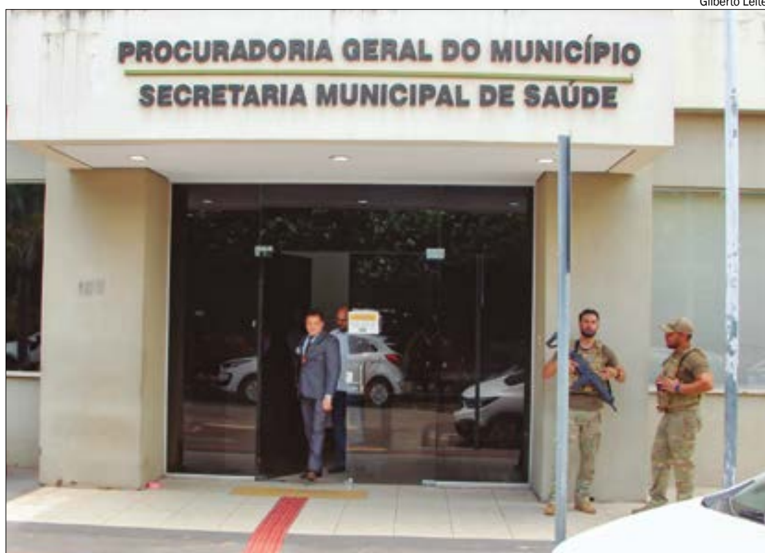
O presidente do TCE já sinalizou que pode pedir a prorrogação caso não vislumbre capacidade da Prefeitura de manter ações em andamento