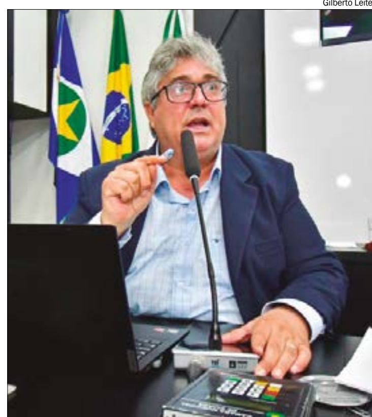
Números apresentados por Galiciani mostram que, até 2019, Cuiabá havia registrado superávit de R$ 2 milhões

A DÍVIDA - Segundo o relatório do TCE, a dívida consolidada líquida da Prefeitura de Cuiabá alcançou R$ 1,2 bilhão no ano de 2022, registrando um aumento de 255% no período entre 2017 e 2022. O MPC emitiu parecer favorável pela reprovação, apresentando quatro irregularidades "graves" e uma "gravíssima" durante o exercício passado. A Prefeitura chegou a apresentar defesa para cada um dos pontos, mas as considerações foram mantidas.