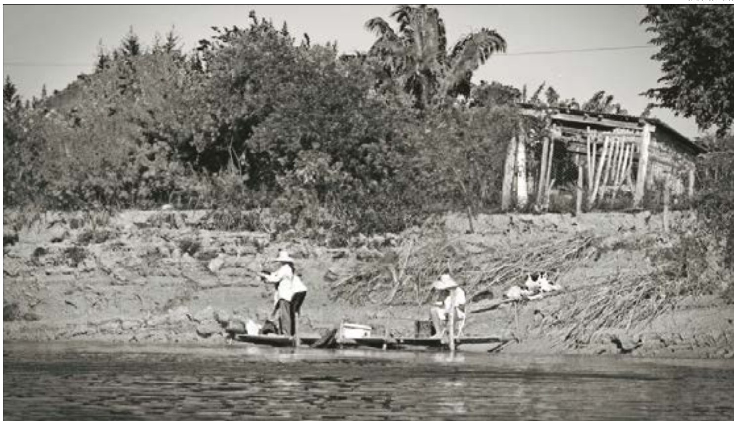
Parecer da PGR afirma que houve exagero em proibição da pesca por 5 anos em Mato Grosso

não há comprovação nos autos de que foi realizada a consulta prévia e informada das populações tradicionais que seriam afetadas pela medida, como determinam acordos internacionais aos quais o Brasil aderiu. E mesmo que houvesse, não há garantia de que seria uma consulta informada, devido à falta