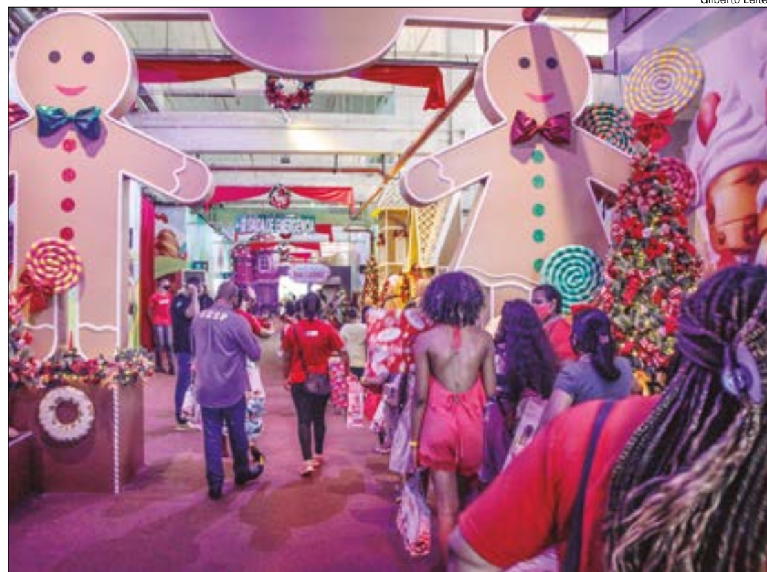
Dados apontam para um crescimento de 14,86% nas vendas durante o Natal e animam os comerciantes

Para 57,6% dos consumidores, a principal forma de pagamento ocorrerá pelo meio parcelado, com destaque para: cartão de crédito (80,9%), crediário (13,7%) e boleto (5,4%). E para quem optou por pagar à vista, os destaques são: cartão de débito (35,8%), dinheiro (32,1%) e PIX/transfêrencia (32,1%). Sobre o planejamento para comprar, 72,9% dos entrevistados ainda não começaram a pesquisar seus presentes e sobre quando pretendem comprar, 73,2% pretendem na semana do Natal, somente 25,1% comprarão antes da última semana da principal data do varejo brasileiro.