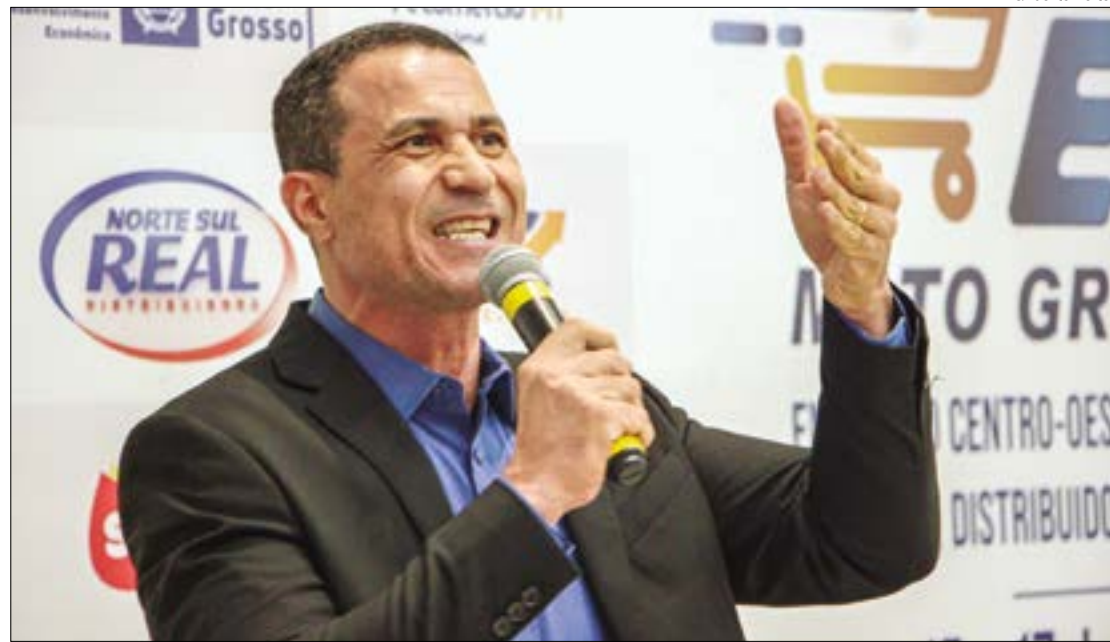
Segundo Assis, há um movimento na Câmara para barrar a ida de Flávio Dino para o STF