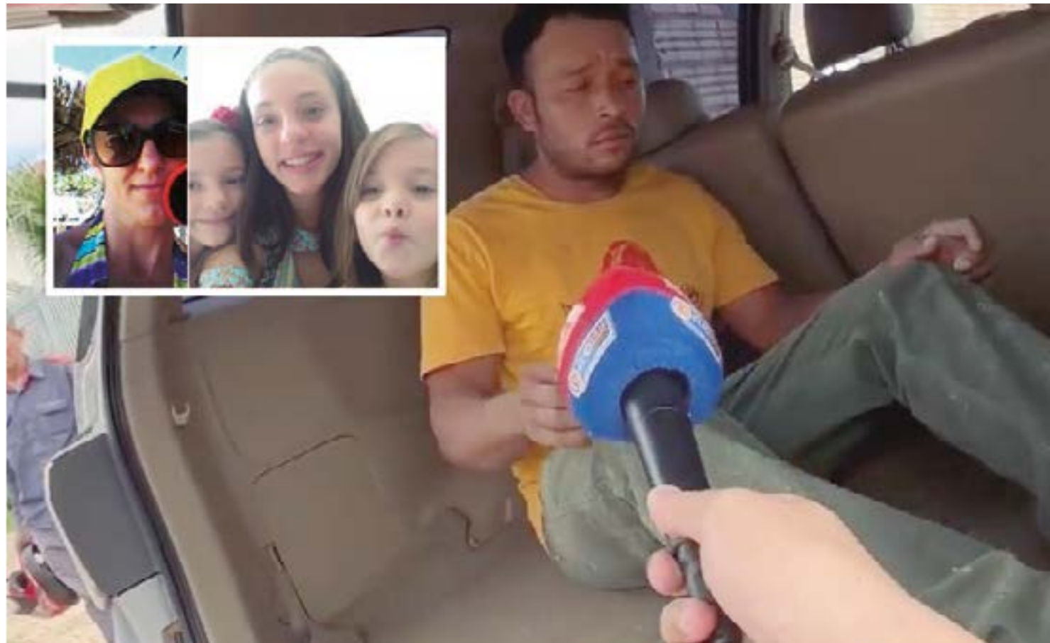
O criminoso confessou ter atacado as quatro vítimas da sexta para o sábado. Ele abusou da mãe e de duas filhas, asfixiando a menor

"O criminoso confessou que atacou as quatro vítimas de sexta para sá-