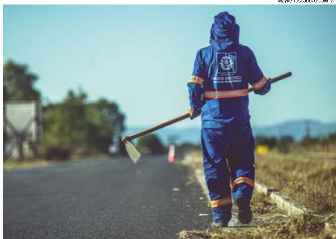
O edital está disponível no site da Sinfra-MT e as inscrições podem ser feitas até 13 de dezembro

O resultado provisório será divulgado no dia 09 de janeiro de 2024 e o resultado final no dia 12 de janeiro. Qualquer alteração no cronograma será comunicada por meio de edital. Outras informações serão divulgadas tanto no site da Legalle Concursos, quanto no Diário Oficial do Estado.