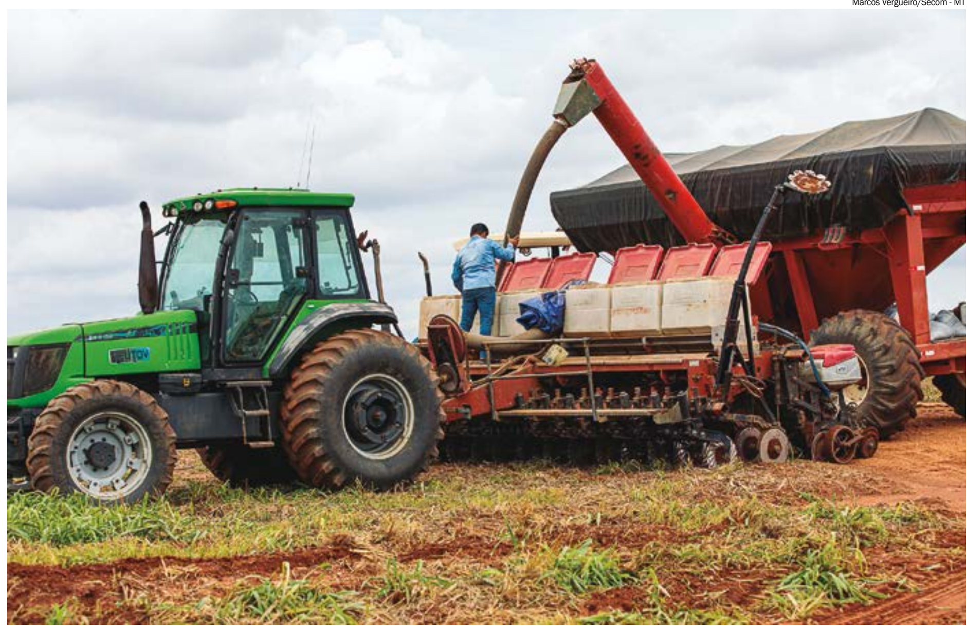
Marcos Vergueiro/Secom - MT