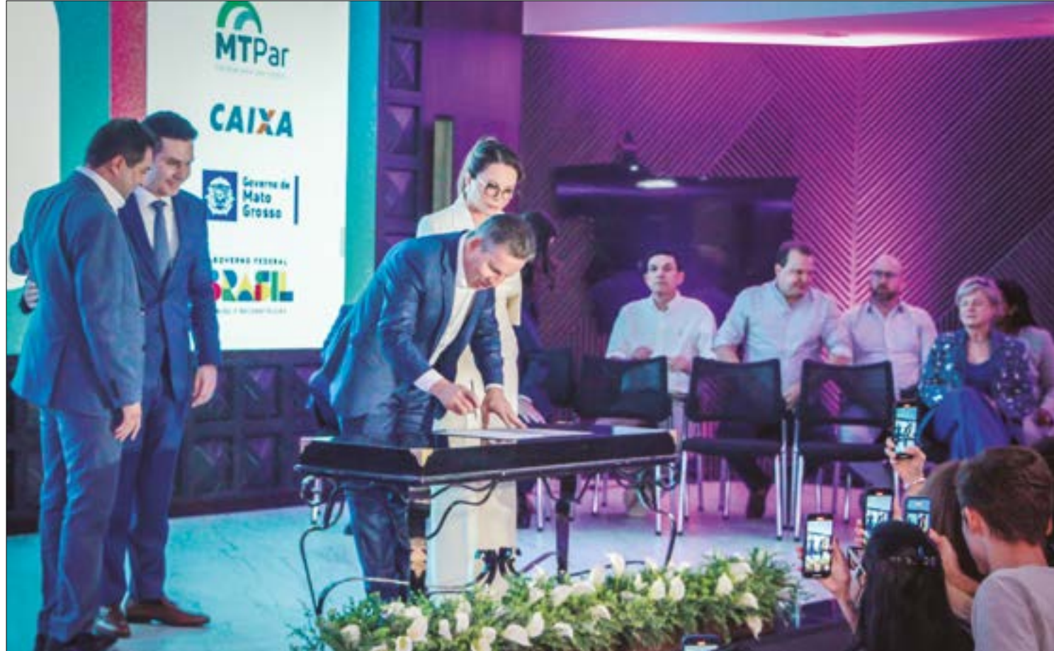
Além de beneficiar famílias com baixa renda, programa prevê subsídios para famílias com renda de até R$ 8 mil