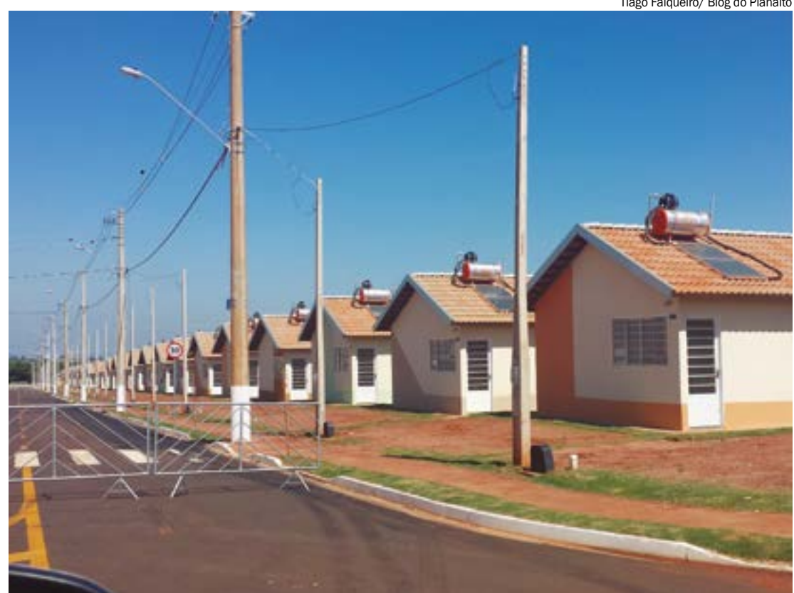
Tiago Falqueiro/ Blog do Planalto