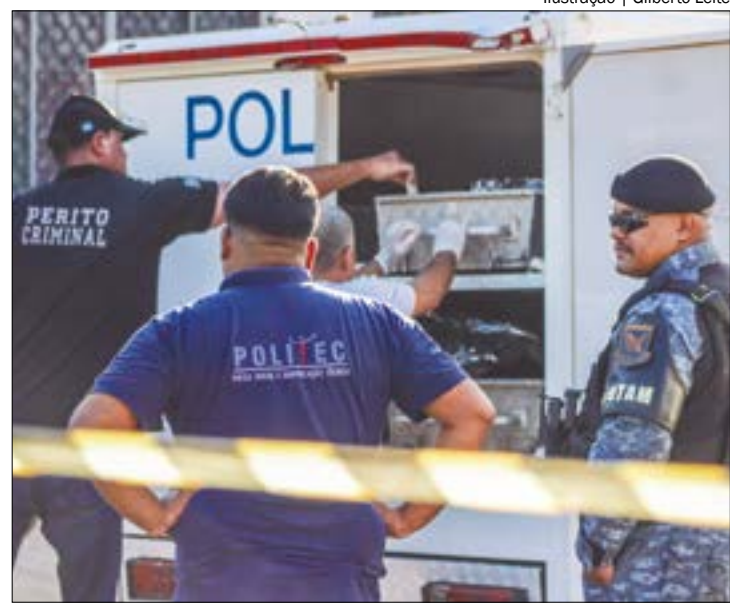
Ilustração | Gilberto Leite

Vanderlei estava desaparecido há 16 dias, e seu corpo foi encontrado em um antigo pedágio da MT-235