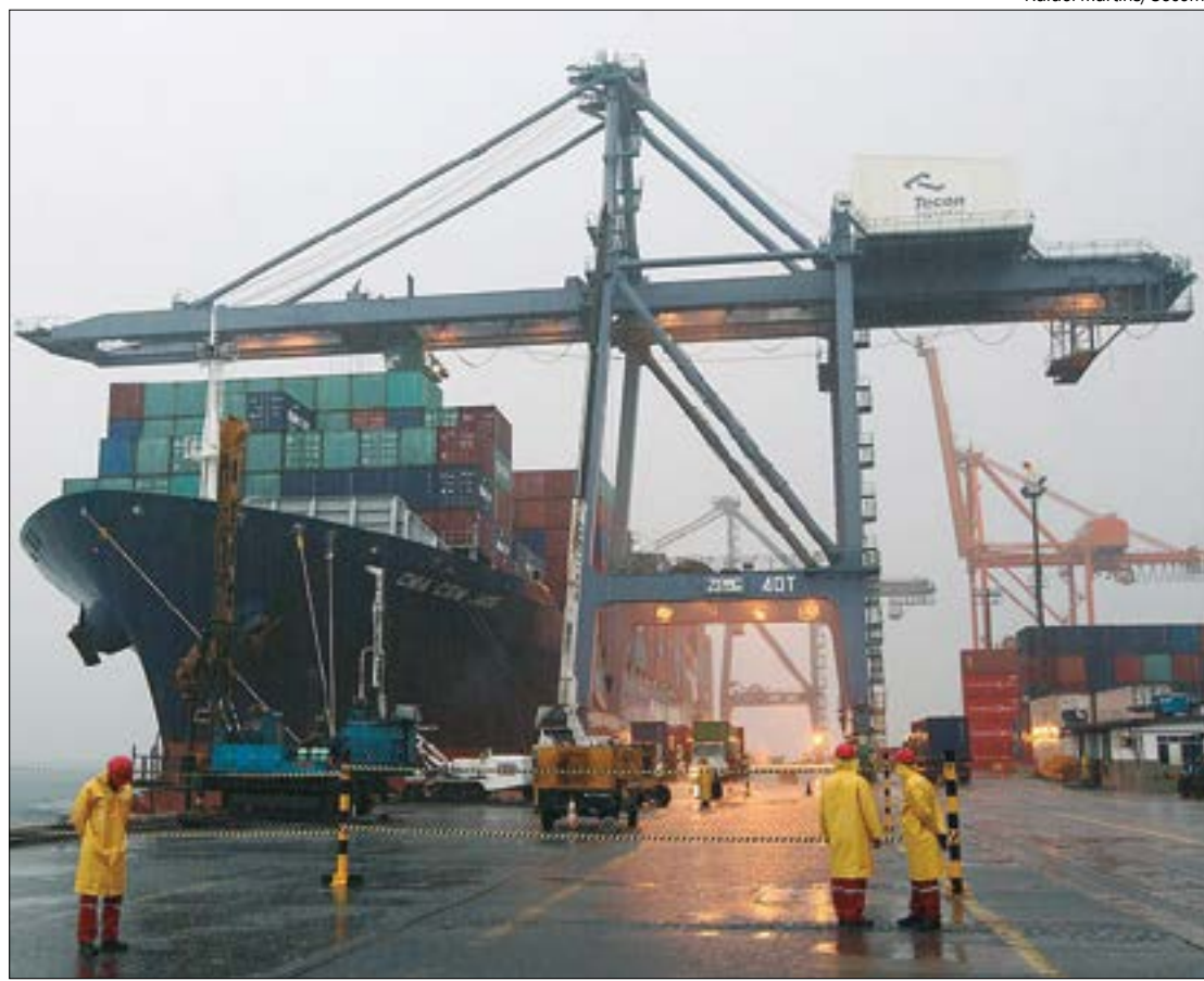
Balança comercial acumula saldo positivo de R$ 86,512 bilhões no ano