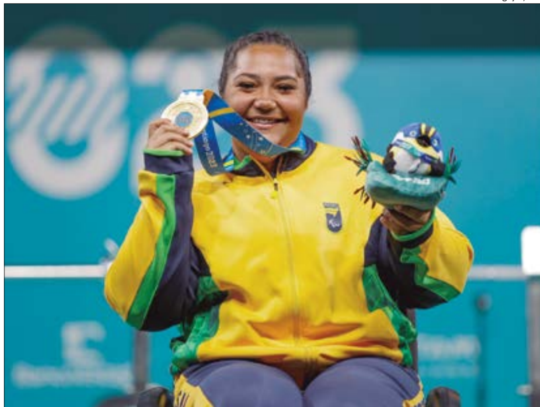
Delegação brasileira lidera o quadro de medalhas, com 55 ouros no Parapan de Santiago, no Chile

"Foi uma prova muito boa, fiz uma passagem boa, a volta pesei um pouquinho, mas deu para sustentar. Fiz o tempo que eu queria, estou muito feliz. Eu gosto muito de sentir essa pressão, desse calor aqui, porque ele [o