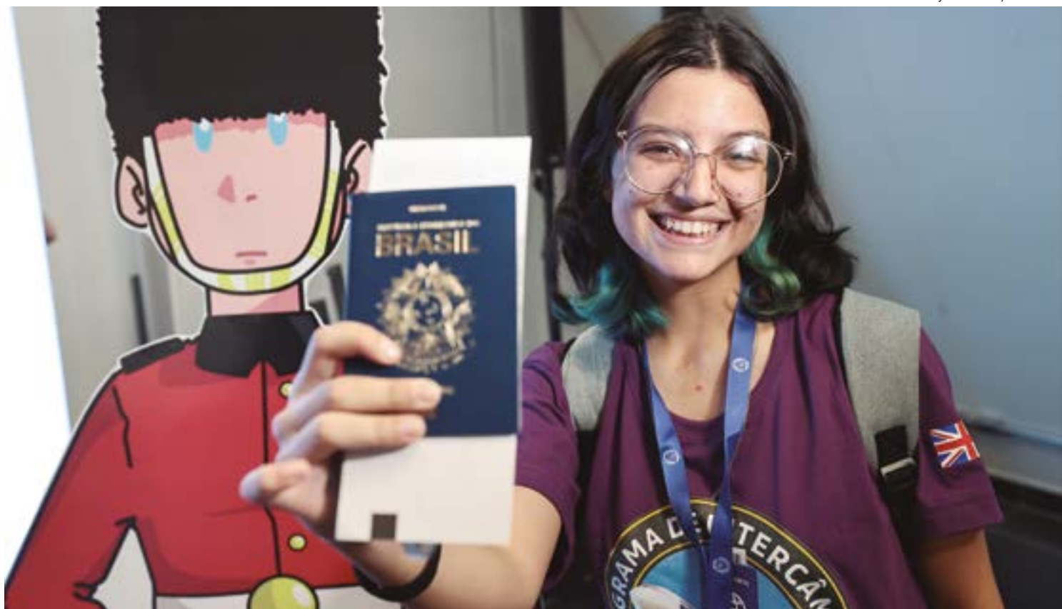
O programa tem duração de três semanas, com documentação, passagens, hospedagens e ajuda para transporte e alimentação pagas pelo Estado

Na avaliação da estudante, a forma em que vê o mundo agora é outra. "Voltei totalmente empenhada em continuar estudando a língua inglesa, após ver o que ela me proporcionou neste intercâmbio. Outro momento que me impactou muito foi o dia da gradu-