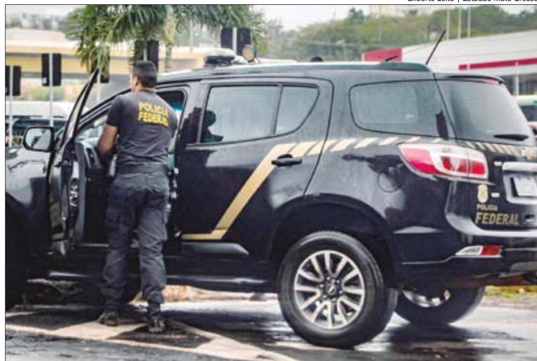
Gilberto Leite | Estádio Mato Grosso

Três postos de combustíveis e duas transportadoras tiveram as atividades encerradas na operação