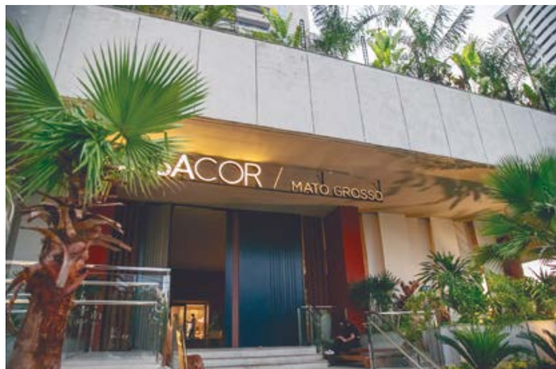
CASACOR Mato Grosso está no Hotel Cuyabá Gold e pode ser visitada das 15h às 22h, de terça a domingo, até 10 de dezembro