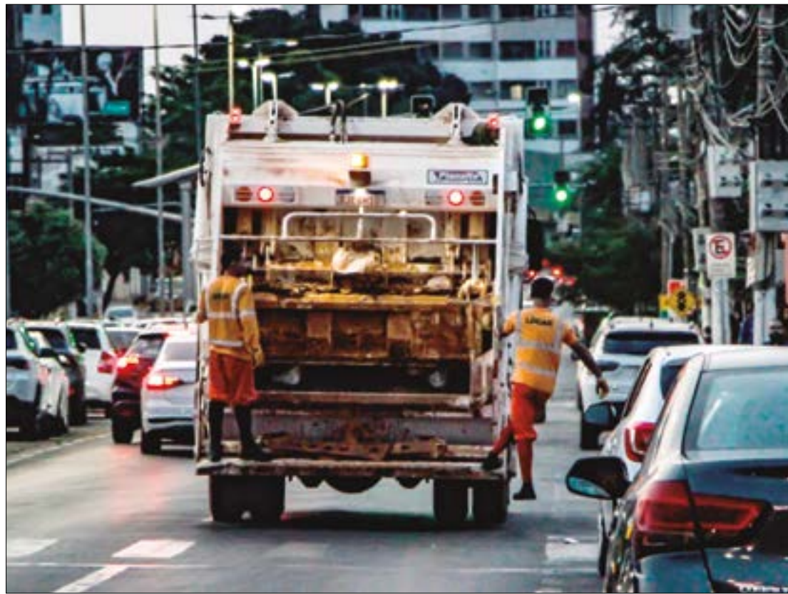
Os trabalhadores informaram que só voltariam ao trabalho após o pagamento dos salários

A empresa terceirizada já havia sido notificada pelo atraso nos salários na terça-feira, 7, pelo Sindicato dos Motoristas e Trabalhadores em Empresas de Transportes Terrestres (Sintrobac), porém, até a manhã de quinta os