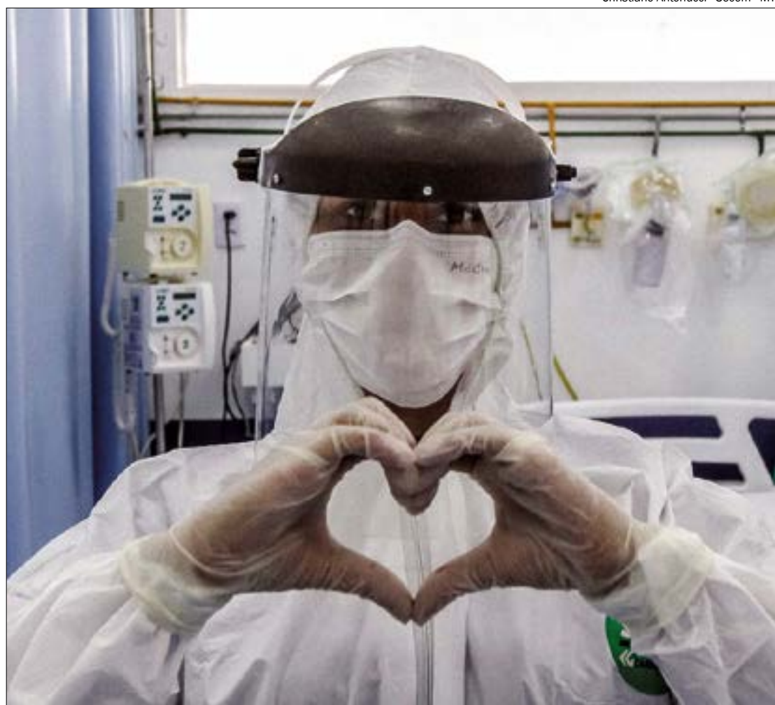
Mato Grosso já registra 151 casos de médicos infectados pelo Covid-19. CRM pede que sociedade ajude no enfrentamento do vírus

"É aí que a sociedade entra em ação evitando aglomerações, festas,