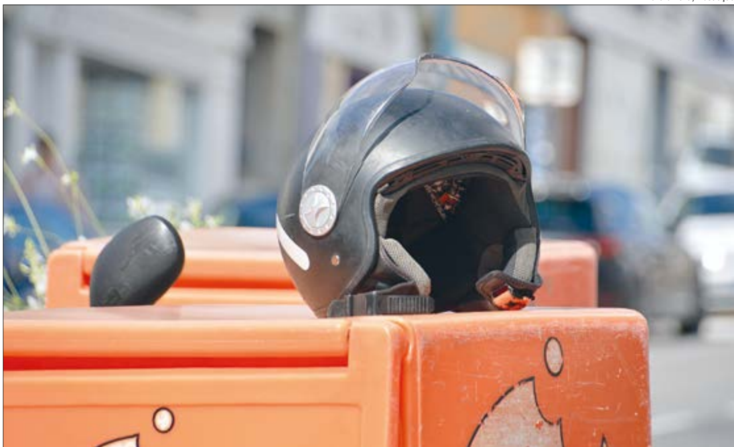
O movimento cobra mais dignidade aos entregadores, que passaram a ser essenciais neste momento de isolamento social

“Essas plataformas ajudaram a divulgar o sistema de delivery no país, que antes era muito tímida. Abriram espaços, mas não têm a preocupação com a qualidade da prestação do serviço e supor-