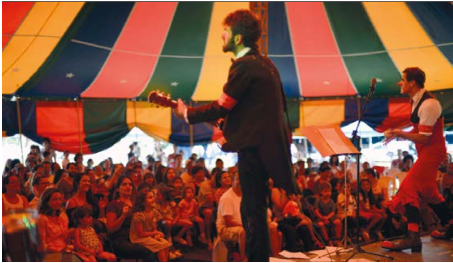
Aqueles que nos faziam rir todos os dias agora estão precisando de ajuda, e algumas plataformas on-line criaram soluções

Uma iniciativa em prol da literatura que será lançada por meio de financiamento coletivo nas próximas semanas é a plataforma Vida de Escritor, que vai oferecer serviços como pareceres críticos