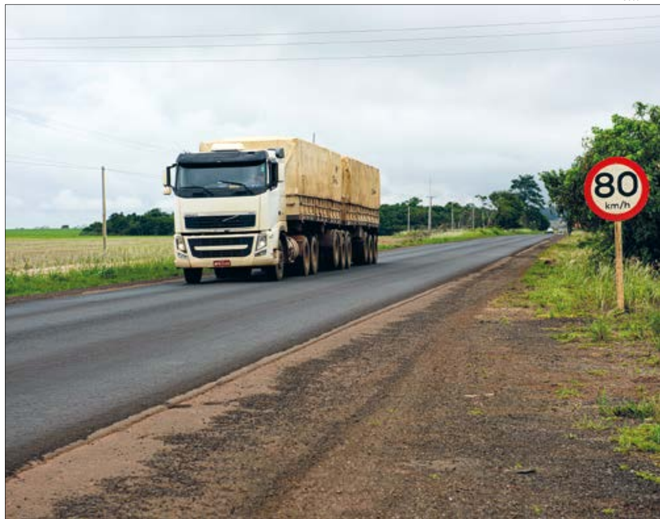
A pavimentação na MT-242 vai melhorar o escoamento da produção e trânsito de pessoas no trecho que liga Itanhangá a Ipiranga do Norte