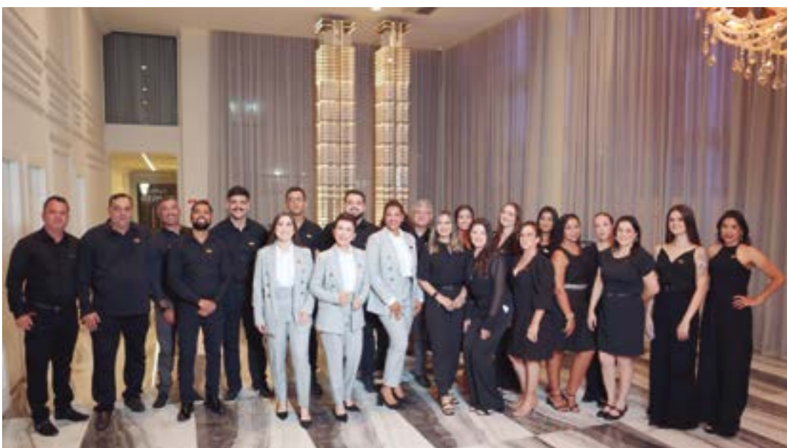
Registro de parte da equipe TMI