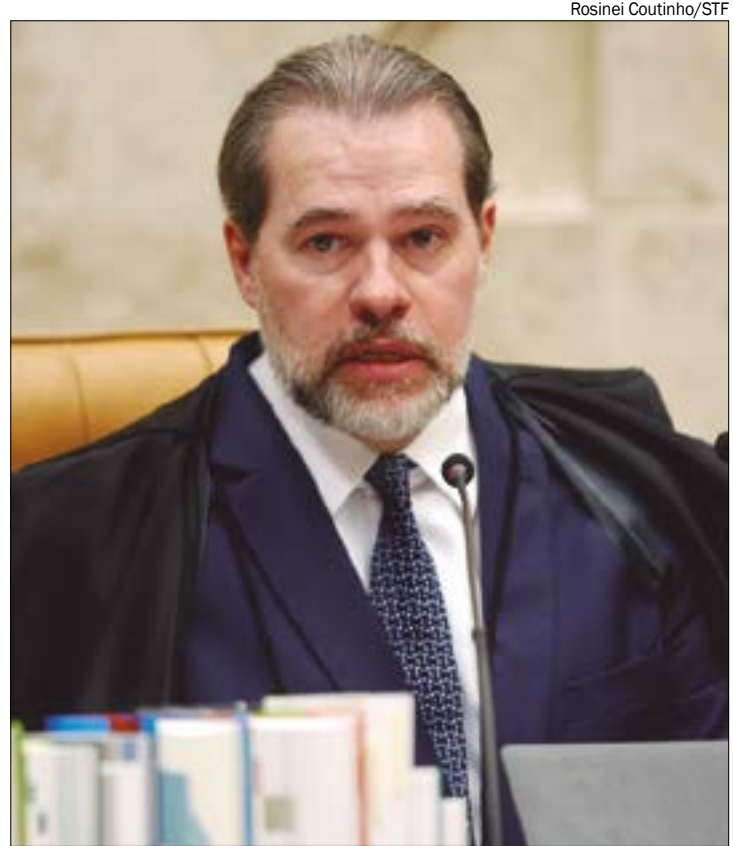
Relator do caso no STF, Toffoli deu prazo de 5 dias para Assembleia se manifestar sobre aumento de emendas