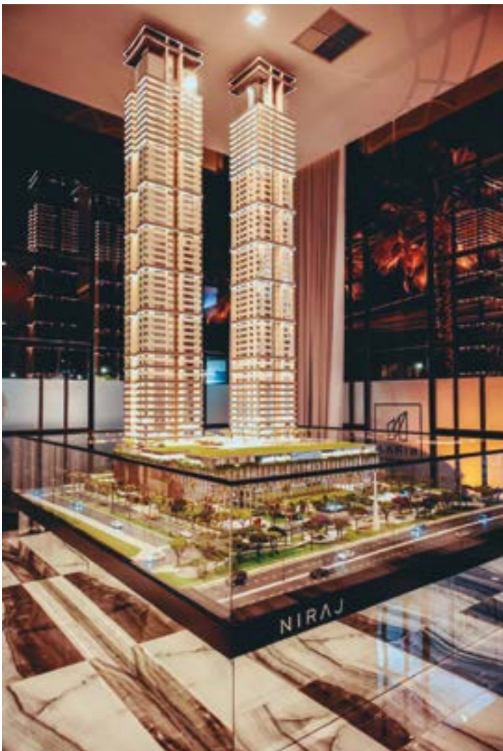
Maquete das torres do Niraj Towers, em Rondonópolis-MT