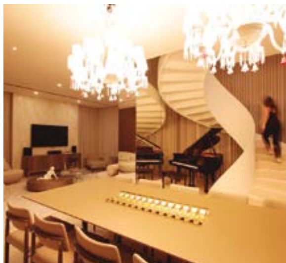
Apartamento duplex decorado do Niraj