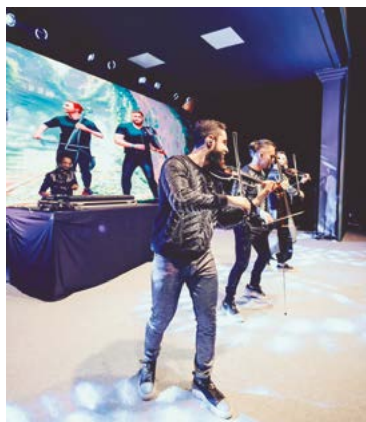
Uma das apresentações da noite, Trio Titanium