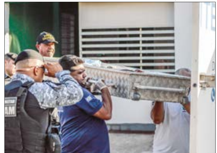
Rodrigo estava em liberdade, e o crime foi capturado pelas câmeras de segurança