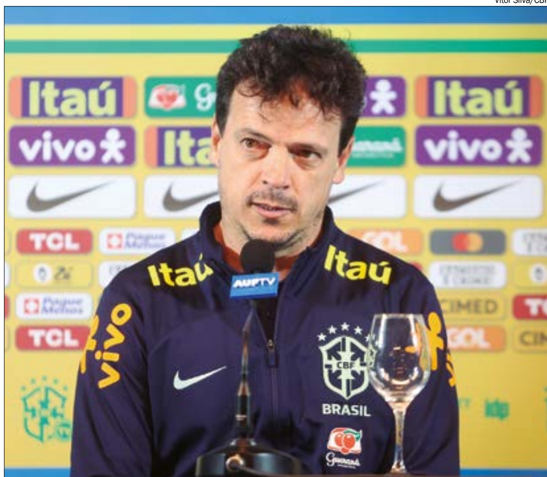
Para Fernando Diniz, faltou agressividade do Brasil na construção das jogadas

"Temos a tendência de simplificar análises para problemas complexos. Se estivéssemos corretos, com Neymar em campo teríamos criado muitas oportunidades, mas isso não ocorreu. Tivemos mais posse de bola no segundo tempo, mas como um todo, não fomos eficazes na criação. A falta de articulação não foi devido a um jogador específico, mas porque a equipe não soube construir. Nesse aspecto, a responsabilidade principal é minha. Não foi por causa da ausência de Neymar. No primeiro tempo, mal conseguimos finalizar", admitiu.