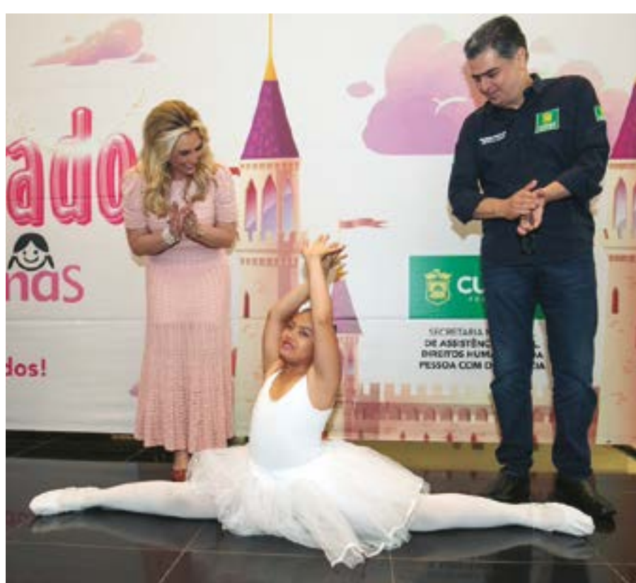
Imagem linda do nosso prefeito de Cuiabá, Emanuel Pinheiro, e da primeira-dama Marcia Pinheiro admirando a linda bailarina do projeto Siminina, projeto este que realizou o evento "O Reino Encantado das Simininas"