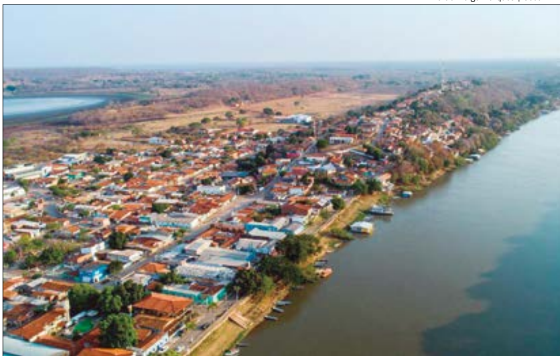
Devido a situação, a prefeita autorizou a mobilização de todos os órgãos municipais para resolver o problema

Ao destacar o problema da cidade, no decreto está descrito "codificado pelo