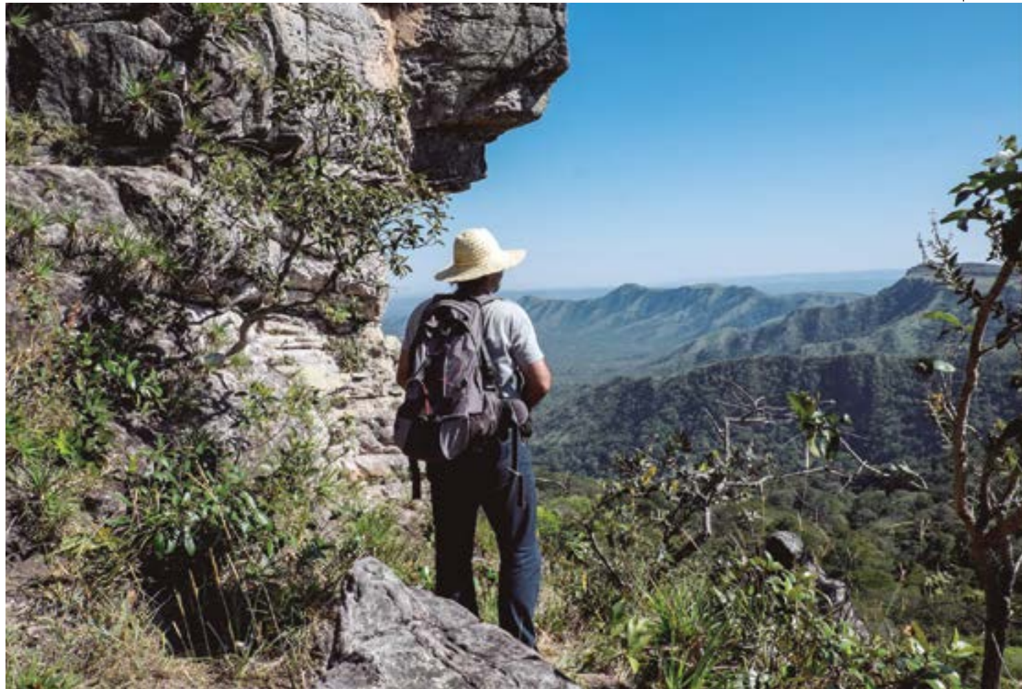
A proposta foi votada pela Comissão e obteve 11 votos a favor e três contrários