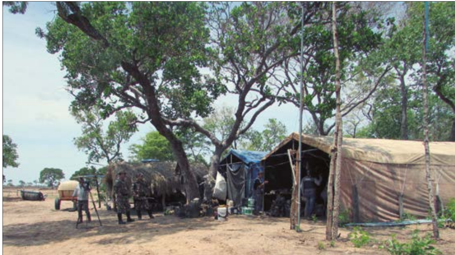
O maior número de pessoas resgatas, nesta nova inclusão em Mato Grosso, se deu na Fazenda Bom Jesus em Paranatinga