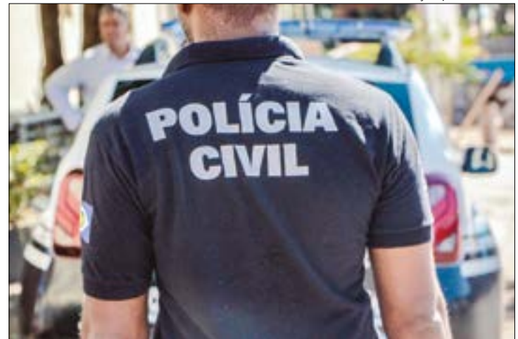
Carlos foi morto com um tiro na cabeça após discutir com um vizinho sobre a demarcação dos limites de sua fazenda