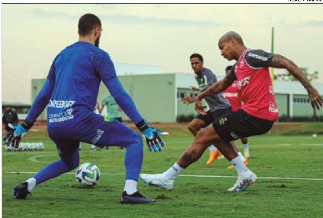
Cuiabá e Cruzeiro se enfrenta neste sábado, a partir das 20h (de MT), na Arena Pantanal

VENDA DE INGRESSOS - Os ingressos para a partida já estão à venda a partir de R$20 (inteira) e R$10 (meia). Eles podem ser adquiridos nas lojas Dourado Store dos shoppings Estação e Pantanal, bem como na Escolinha do Cuiabá, na Avenida Beira-Rio, e na Casa de Festas (Jd. Petrópolis). A compra online pode ser feita através do site www.tickethub.com.br .