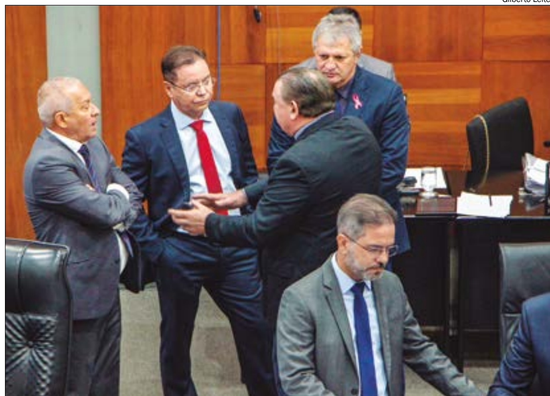
Os deputados estaduais devolveram o Projeto de Lei Orçamentária Anual (LOA) de 2024 antes de começar a tramitação da peça