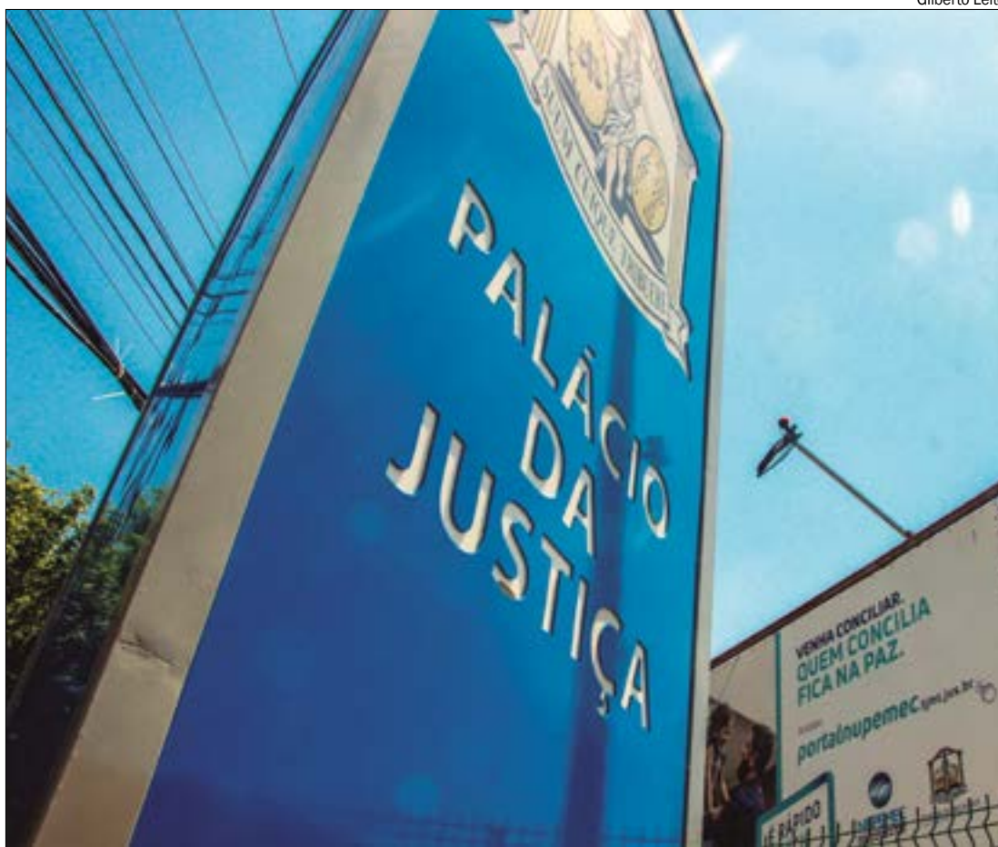
Ao todo, serão 9 novos magistrados para compor a 2ª instância do órgão, sendo 7 juizes de carreira, um advogado e um membro do MP-MT

QUINTO CONSTITUCIONAL - Os Tribunais de Justiça obedecem à regra do chamado Quinto Cons-