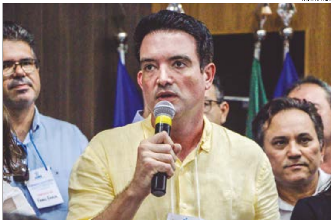
Após a vitória, o novo presidente da AMM garantiu que pretende focar sua gestão no desenvolvimento de cidades mais carentes

do ministro da Agricultura e Pecuária, Carlos Fávaro, e um incentivo tímido do Palácio Paiaguás.