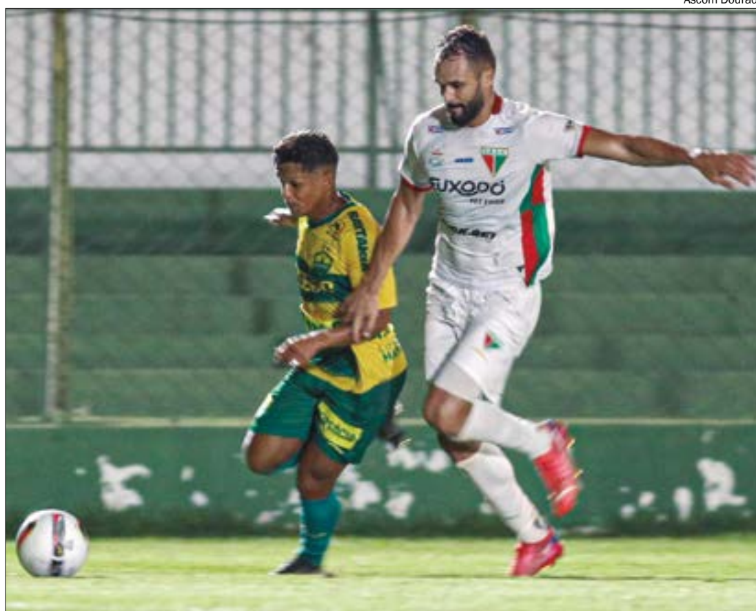
Na primeira rodada, o Dourado encara o Operário-VG, no Dutrinha