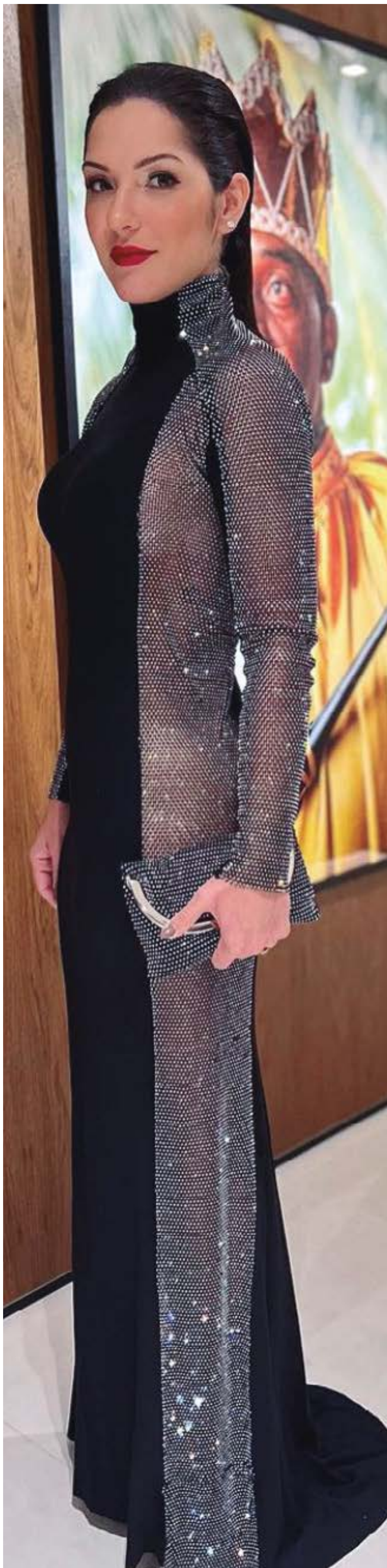
Belíssima a Deputada Estadual Janaina Riva