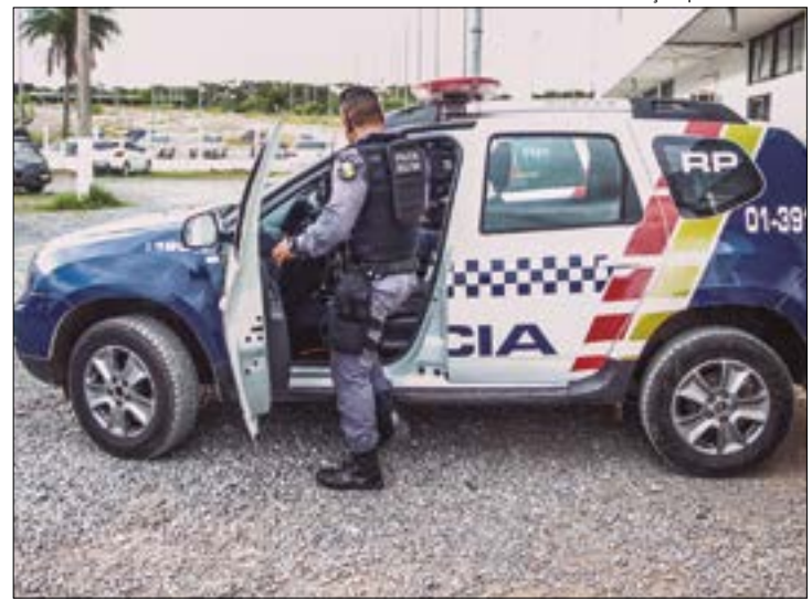
Os envolvidos no assalto fugiram e o funcionário baleado foi socorrido e levado ao hospital