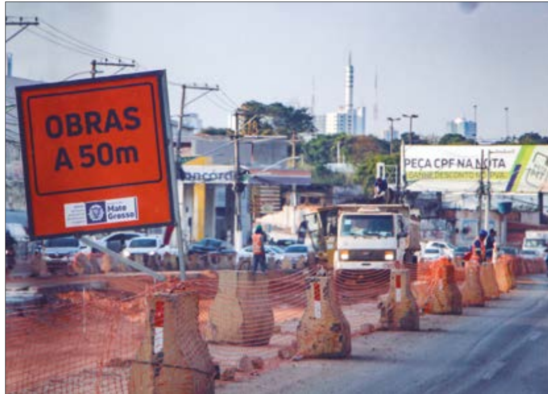
As obras na Avenida Fillinto Müller e na Couto Magalhães já deviam ter iniciado, mas causaram desgastes com os comerciantes