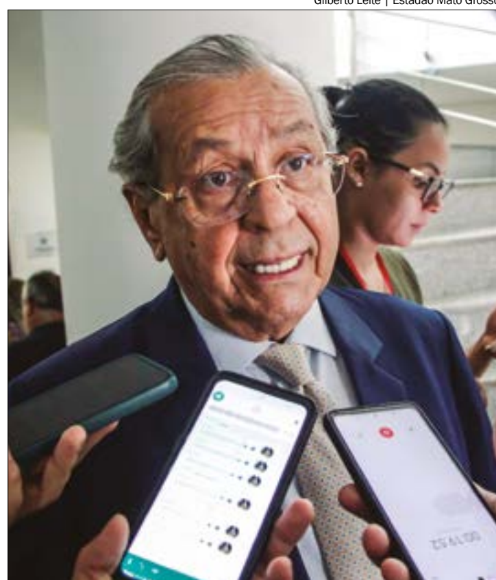
A crítica do senador Jayme Campos se deu após os Poderes terem apresentado entendimentos diferentes sobre o Marco Temporal

“Nós temos três poderes no Brasil: Executivo, Legislativo e Judiciário; todavia, trabalhamos de forma harmônica, mas cada um cumprindo a sua missão constitucional. Por isso, tenho alertado o presidente do Senado, Rodrigo Pacheco, para que tome uma posição em nome do Senado; caso contrário, com certeza, nós não te-