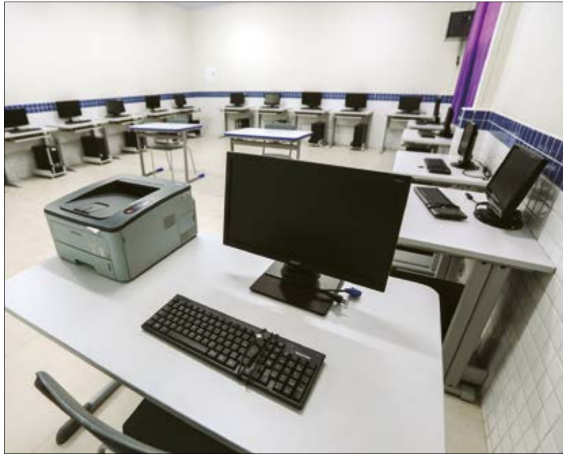
Em Mato Grosso, 410 instituições de ensino vão receber internet de qualidade por meio do Escolas Conectadas