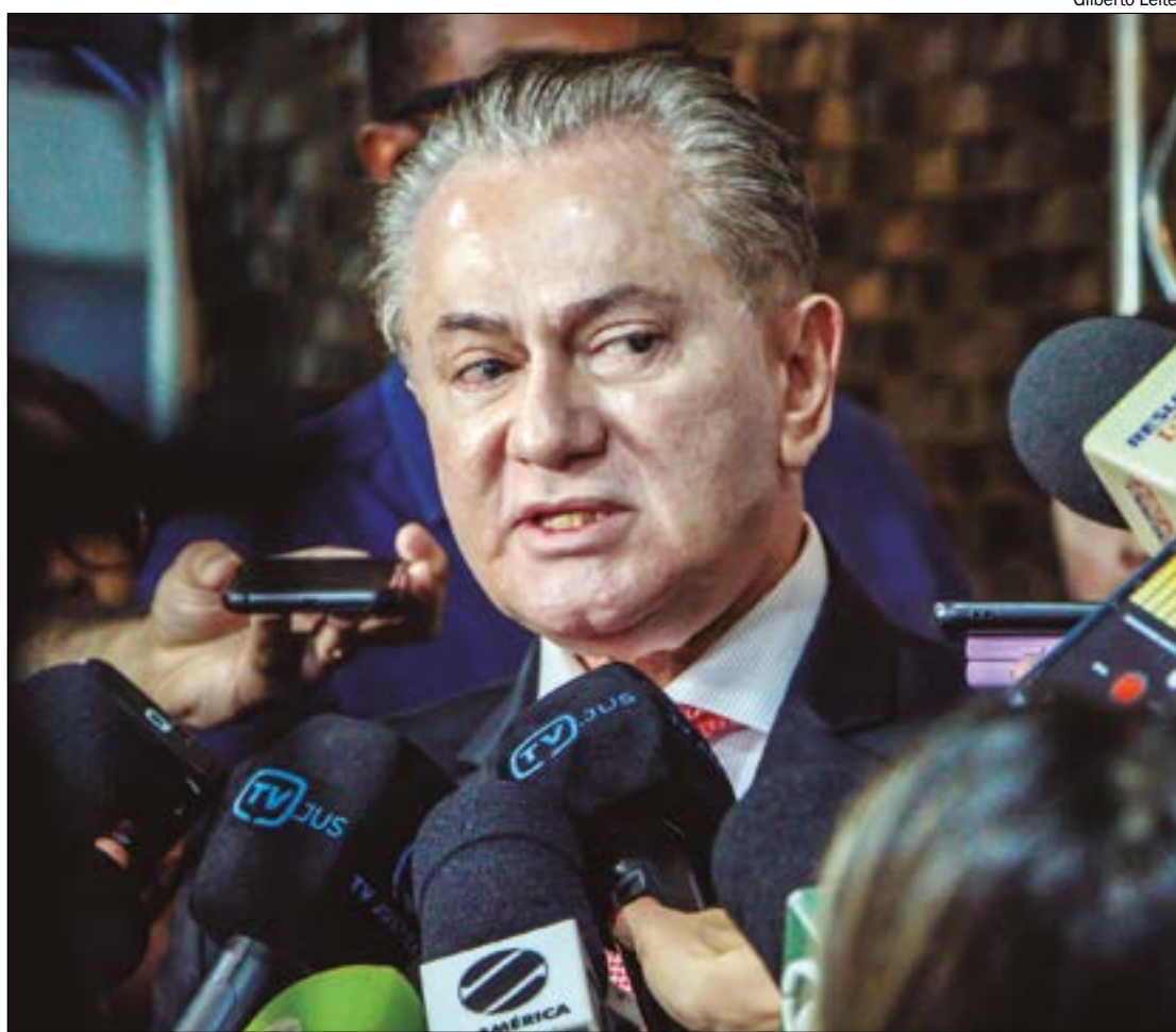
Perri destacou que a participação empresarial está devidamente inserida em sua declaração de imposto de renda

Além disso, o desembargador destacou que a participação empresarial está devidamente inserida em sua declaração de imposto de renda.