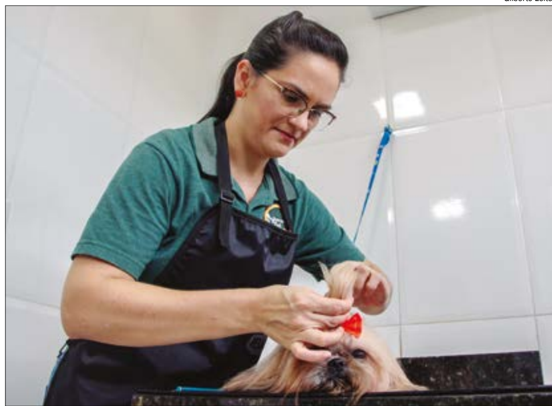
Entre os serviços e produtos oferecidos pelo setor, banho e tosa representam 13%

SOBRE A PESQUISA - A pesquisa sobre o “ Cenário de atuação dos pet shops no estado” seguiu metodologia quantitativa, com total de 77 pequenos empresários respondentes. As entrevistas ocorreram via telefone, entre os dias 8 e 17 agosto. A margem de confiança é de 95% e 4% de erro.