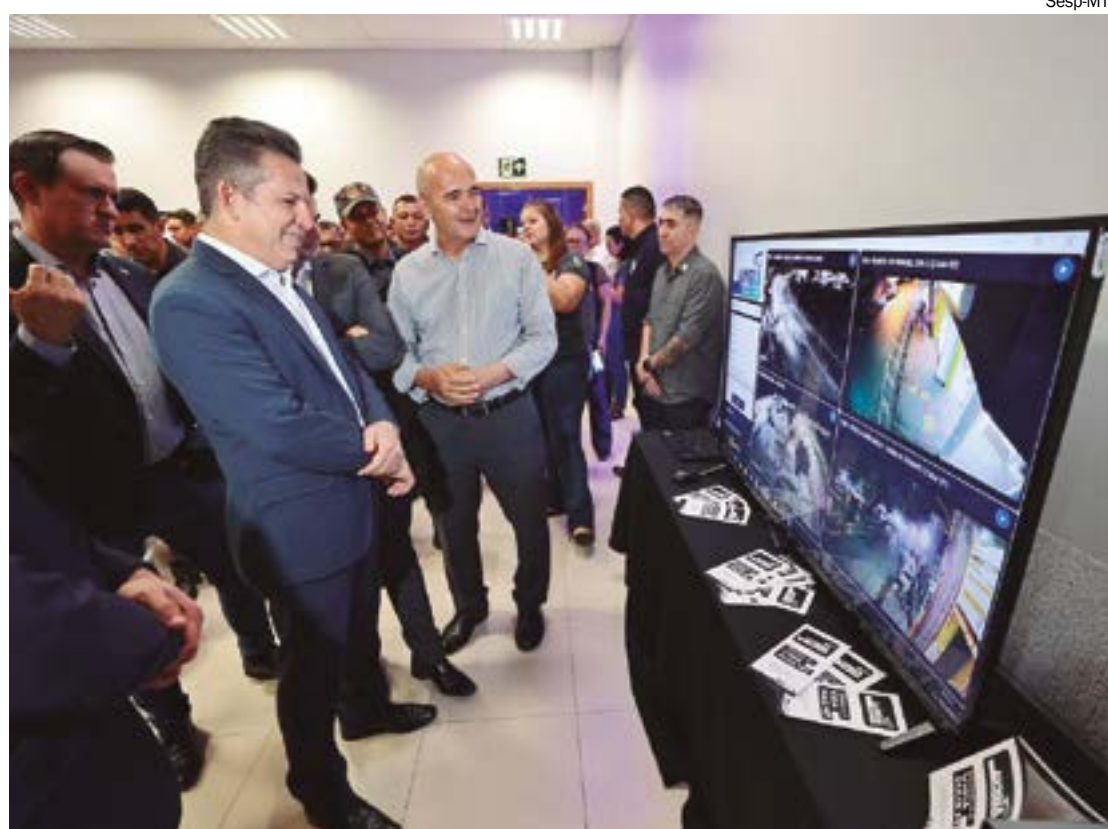
Segundo a CDL, 260 comerciantes já cadastrados vão receber e se responsabilizar pelas câmeras

Os equipamentos são entregues em três modelos, fixas, speed domes e OCRs, acompanhadas de suporte de conservação de energia e proteção como nobreaks, switch's e armários.