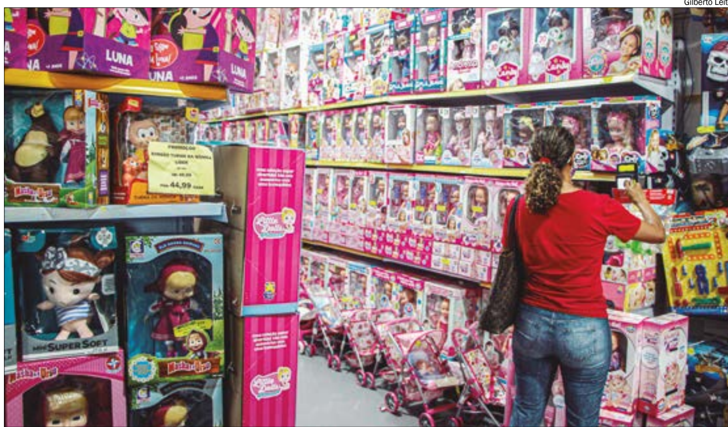
Pesquisa da CDL Cuiabá revela que mais de 97% dos consumidores pretendem comprar presentes no Dia das Crianças

Segundo a pesquisa o fator mais decisivo na escolha do presente é o desejo da criança com 81,8%, se-