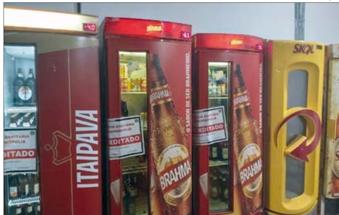
Em Rondonópolis está proibida a venda de bebidas alcoólicas, mas a polícia encontrou distribuidora aberta e com os freezers lotados

Após os procedimentos necessários no local, a Polícia Militar registrou o boletim de ocorrência informando que o proprietário infringiu o artigo 268 do Código Penal que caracteriza a ação (infringir determinação do poder público destinada a impedir introdução ou propagação de doença contagiosa).