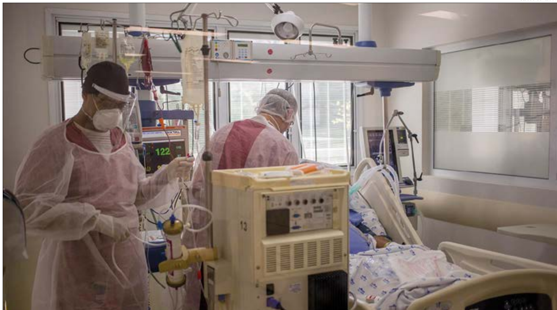
Fiscalização encontrou inconformidades em 8 das 10 unidades de saúde visitadas

Foram inspecionados o Hospital e Pronto-Socorro Municipal de Cuiabá,