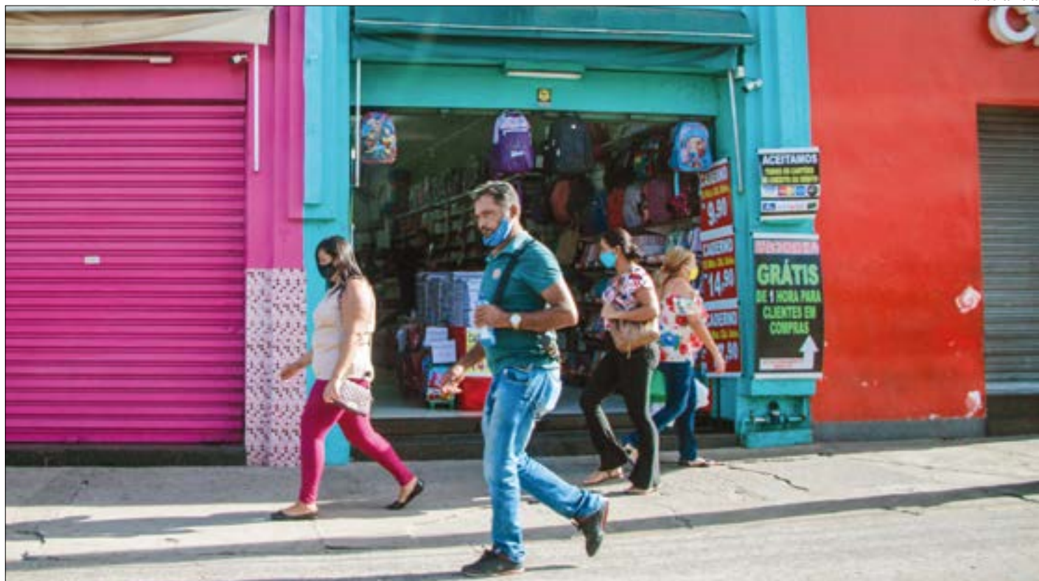
Lockdown em Cuiabá começou a valer ontem, mas alguns comércios ainda abrem

O mesmo MP-MT que acusou o Estado de omis-