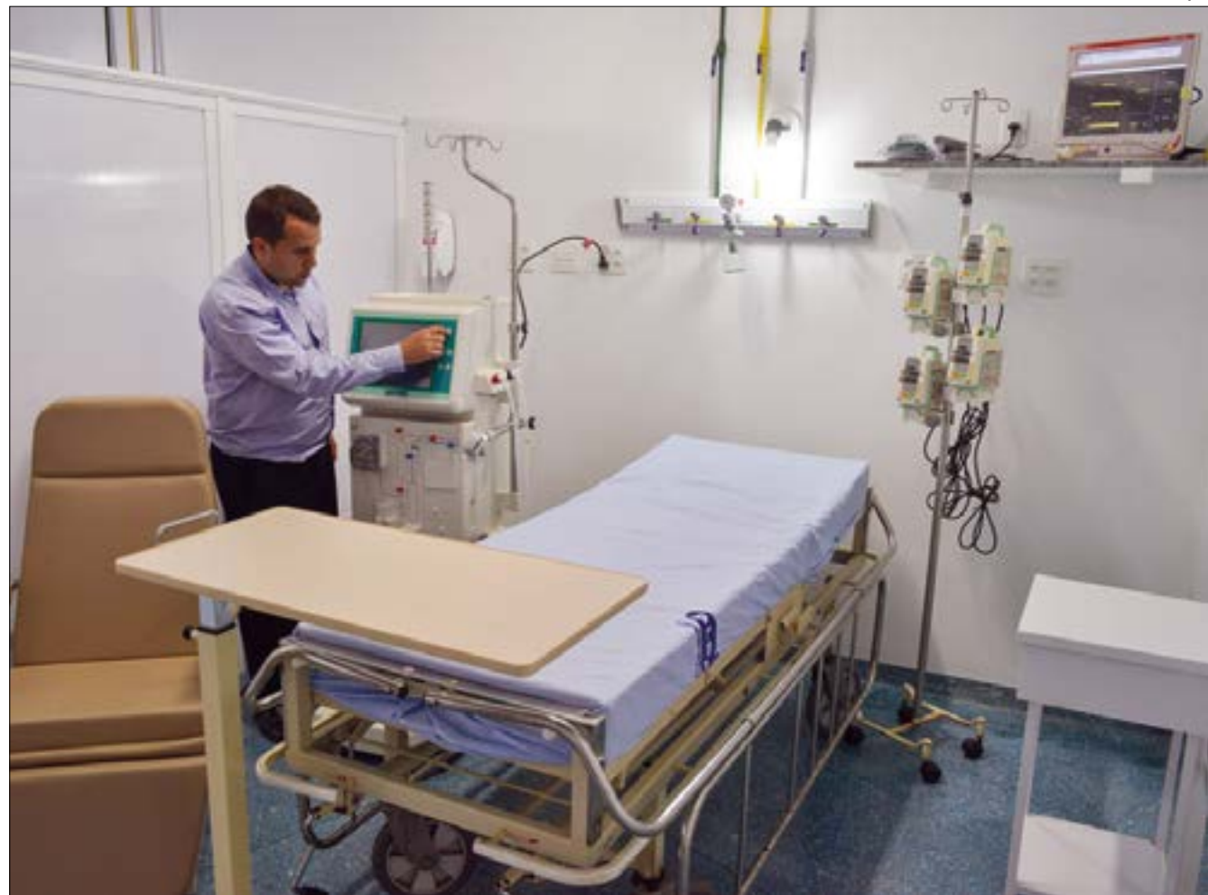
Estado comprou e pagou os 50 respiradores, mas os produtos foram travados pelo governo federal