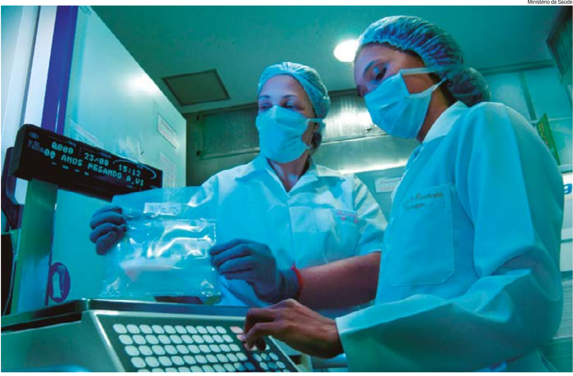
Ministério da Saúde

A doação de órgãos em Mato Grosso subiu 300% em relação ao ano passado. Isso porque os dados da Secretaria Estadual de Saúde (SES) apontam que em 2022 apenas duas pessoas doaram os órgãos, enquanto que até 13 de setembro de 2023 seis pessoas se tornaram doadoras. Apesar do crescimento, o número ainda é baixo. Um dos principais problemas na defasagem do número de doadores está relacionado à falta de aceitação da família em doar os órgãos de seus entes queridos. O desejo da pessoa só é respeitado com o aval da família, por isso é tão importante que o assunto seja abordado no seio familiar. Esse ano, até o momento, 17 pessoas receberam transplantes no estado