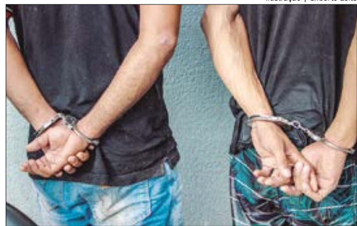
Um dos suspeitos estava armado e, assim que viu os policiais, largou a arma e ambos se renderam