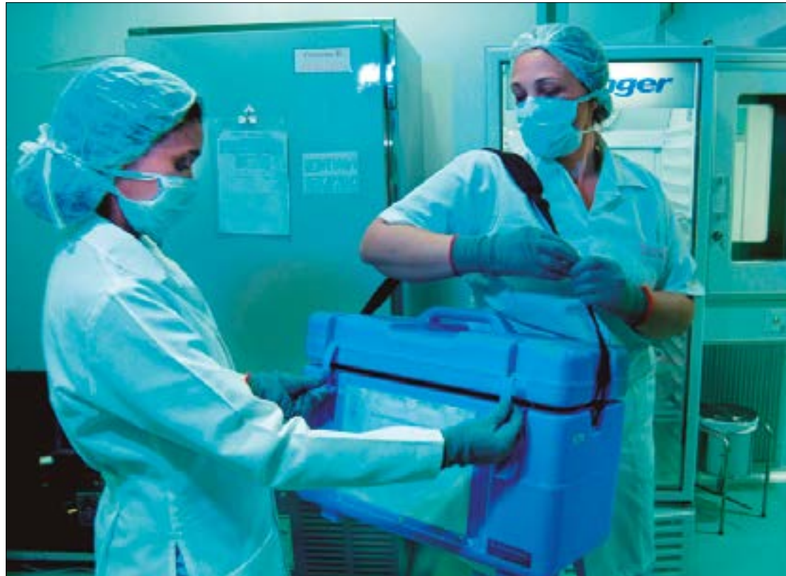
Em 2023, 17 pessoas já receberam transplantes em Mato Grosso. No ano passado, seis pessoas, segundo a Secretaria de Estado de Saúde