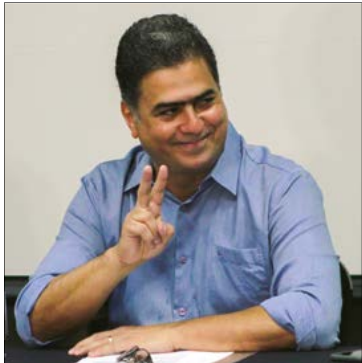
A instalação do processo poderia culminar na cassação do prefeito, mas a proposta foi enterrada por 13 votos contrários

Tempo de Serviço (FGTS) e nem fazer o repasse dos descontos feitos em folha ao Instituto Nacional do Seguro Nacional (INSS) dos servidores públicos. A instalação do processo poderia culminar na cassação do prefeito, mas a proposta foi enterrada por 13 votos contrários, 8 favoráveis e 1 abstenção. A votação foi realizada na sessão ordinária desta quinta-feira, 21 de setembro. (Veja como cada vereador votou abaixo)