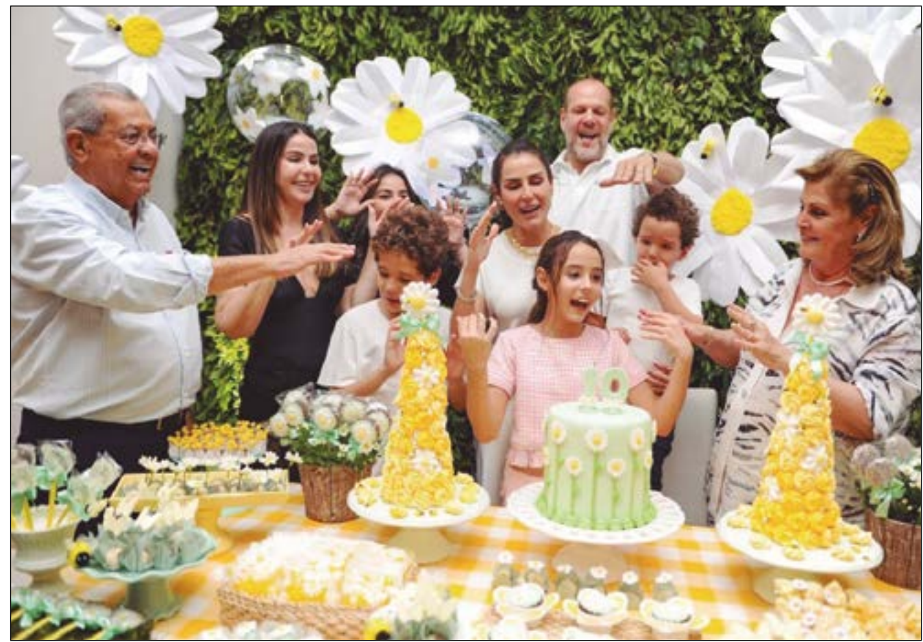
Hora do parabéns, momento abençoado