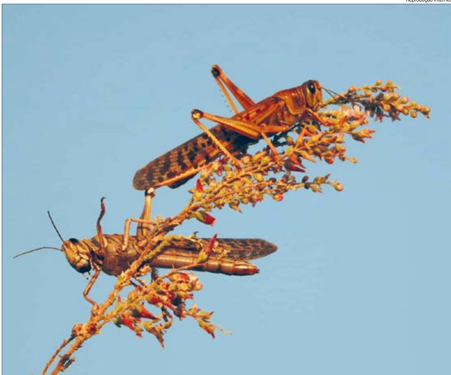
Estes insetos não afetam a saúde humana ou de animais, mas podem afetar a atividade agrícola

“O gafanhoto é considerado uma das piores pragas da agricultura brasileira. É um inseto fitófago, extremamente voraz, chegando a consumir, diariamente, em massa verde, o equivalente a seu peso. Quando atingem altas populações, destroem completamente as lavouras, causando grandes prejuízos ao produtor. De acordo com seu comportamento, podem ser divididos em dois grupos: os sedentários, com hábito solitário e pouco nocivos; e os migratórios, que apresentam hábito gregário formando