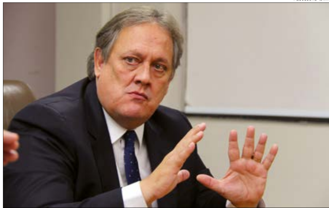
Desembargador destaca que falta de cuidados da população tem levado à evolução da pandemia

“Como assim me parece, na atualidade é a própria fiscalização oficial e a enorme falta de conscientização da população a proporcionarem não uma involução, mas uma evolução de transmissão de contágio e aumento dos óbitos, que como se disse em momento antes, por mais que houvesse dinheiro, seria sempre insuficiente, pois o ‘milagre’ está exatamente na disciplina que todos devemos ter para superarmos este período de pandemia, e não ficar-se esperando que alguém venha aqui salvar a todos com uma ‘varinha mágica’”, destacou o desembargador.