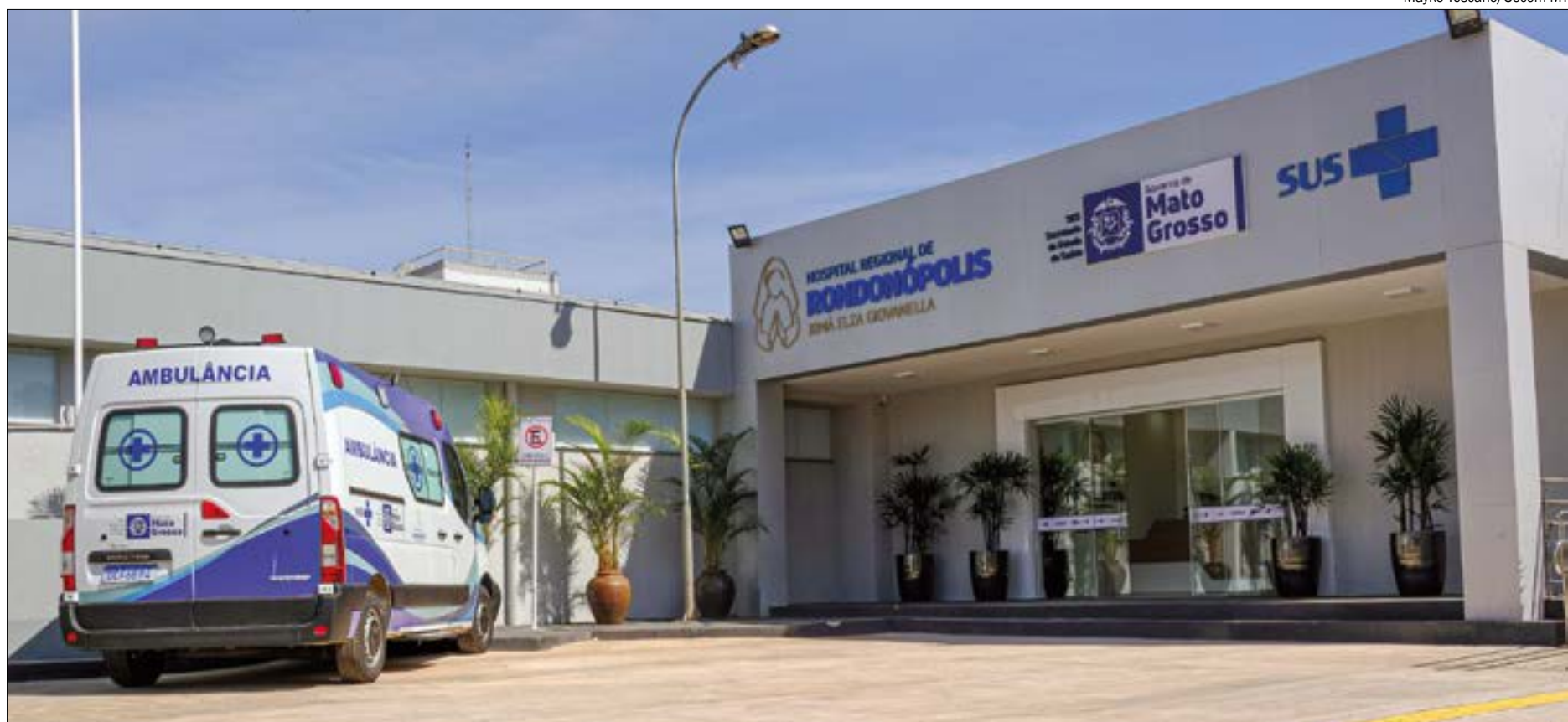
Rondonópolis é um dos municípios que têm uma taxa de ocupação dos leitos de UTI muito alta

Essas cidades foram avaliadas de acordo com três faixas de classificação de risco: cidades com 50 casos ativos, com 51 a 150 casos e aquelas com