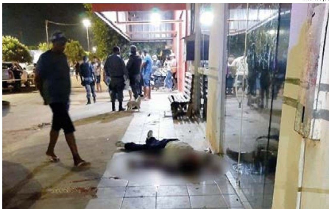
Três morreram, a vítima e os dois acusados de praticar o crime; outras duas pessoas ficaram feridas

Após atirar na vítima, o assassino retornou à motocicleta para fugir com o comparsa, quando um agente penitenciário passava pelo local e atirou na