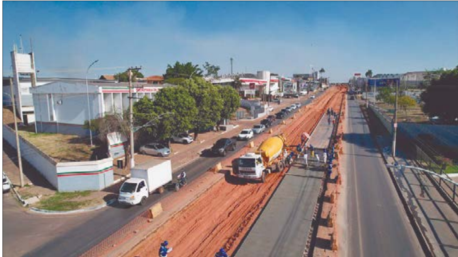
Vendo a situação da Av. da Feb, empresários temem impacto do caos das obras do BRT e fim de faixas de estacionamento