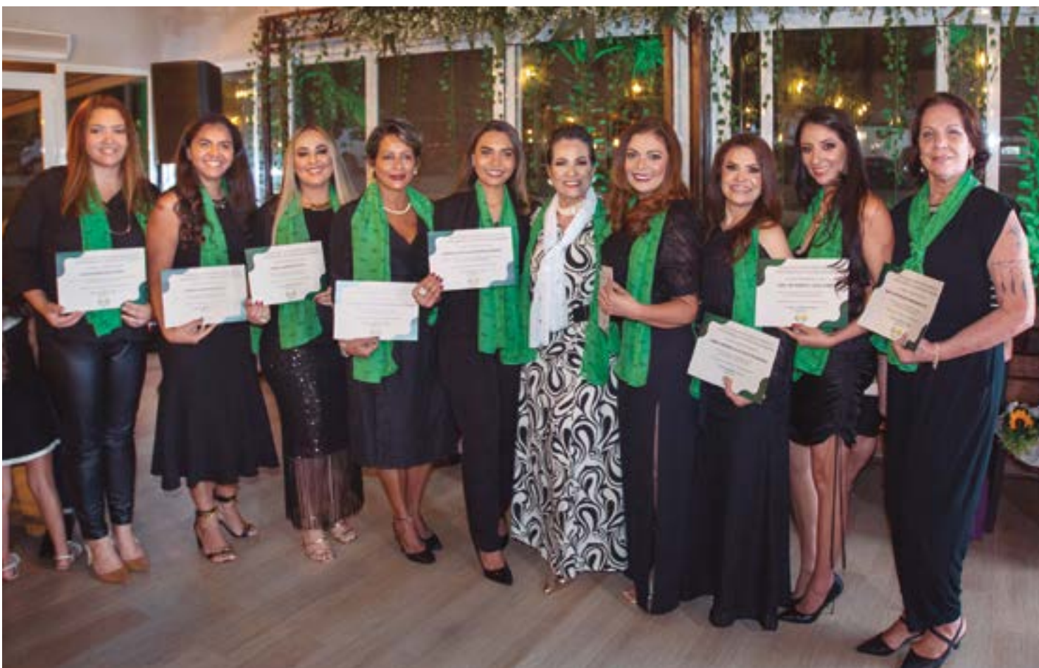
Mulheres fortes e determinadas para fazer a BPW de Chapada dos Guimarães ser referência nacional