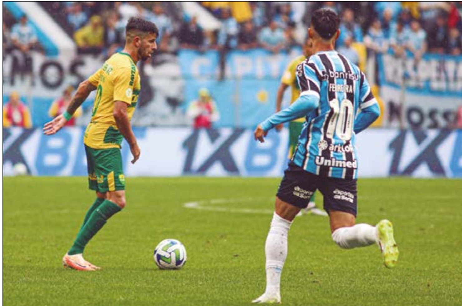
Cuiabá teve atuação apagada contra o Grêmio e sofreu com falhas pontuais de seu elenco