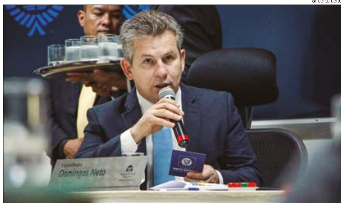
Segundo Mauro, ampliação das escolas cívico-militares atende pedido de pais de estudantes

militares. O objetivo é chegar a 50 nos próximos anos. Segundo o governador, esse tem sido um pedido frequente de pais de estudantes e lideranças políticas de Mato Grosso.