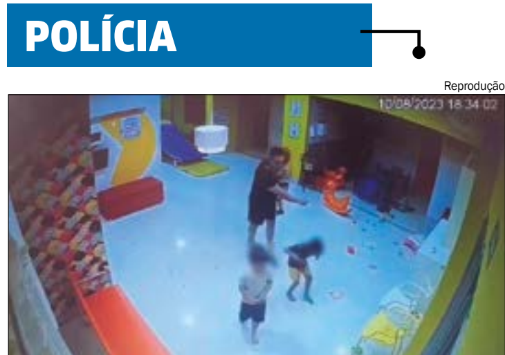
O homem disse que não se importa com o fato da criança ser autista e que bateria novamente nela

Apesar das acusações, ele foi absolvido na Justiça sob a alegação de falta de provas. No entanto, a Polícia Militar o demitiu.