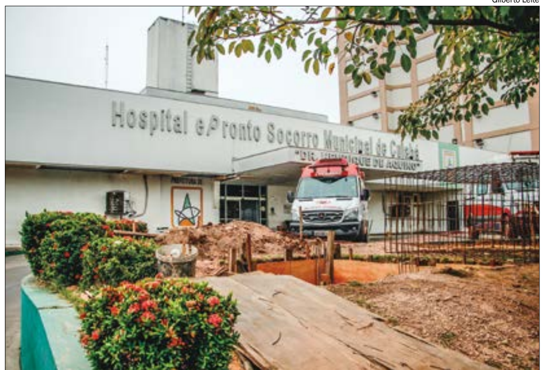
A unidade tem previsão de entrega até o final deste ano e será implantada no antigo Pronto-Socorro, com atendimento portas abertas 24h

"Estamos realizando as cirurgias dentro do programa Fila Zero, neste mutirão de cirurgias, e já zermos a fila em seis especialidades. Isso é inédito em Cuiabá. No Hospital Metropolitano, em Várzea Grande, já zermos a fila da cirurgia bariátrica", citou.