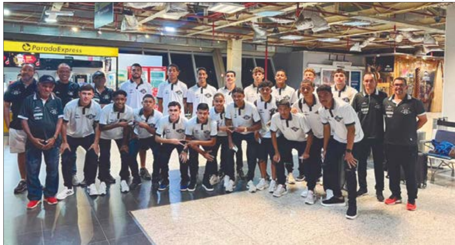
Delegação do Mixto Sub-20 embarcou nesta terça, 15, para enfrentar o América em Belo Horizonte

Esta competição nacional funciona no sistema eliminatório. Definido por sorteio, na primeira fase, os times se enfrentam em apenas um jogo na casa do melhor ranqueado do confronto. Quem vencer avança. Em caso de empate, a decisão da vaga será nos pênaltis.