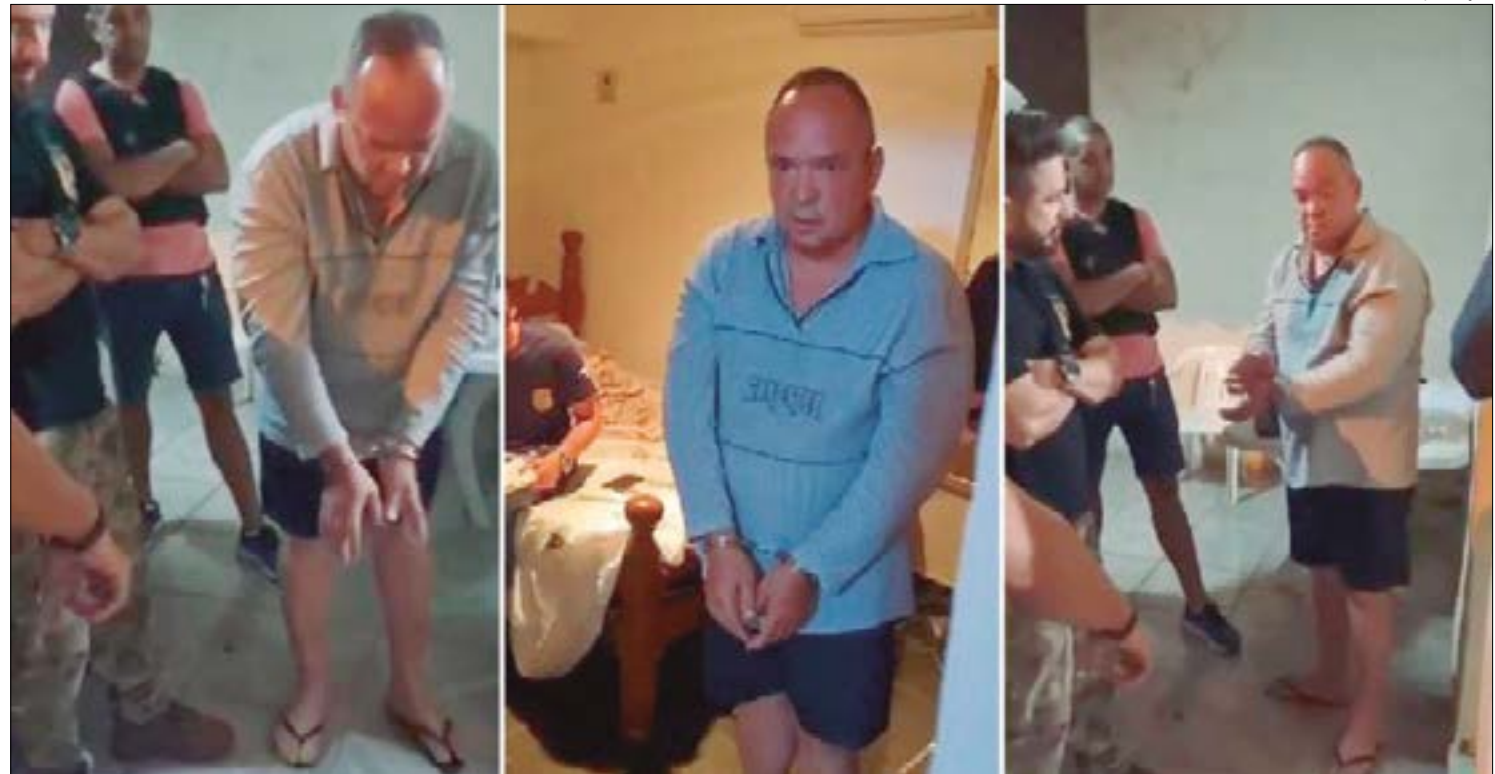
Segundo a Polícia Civil, o suspeito estava lavando a casa na hora em que os policiais chegaram para efetuar a prisão