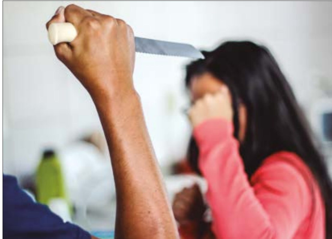
89% das vítimas de feminicídios foram mortas por companheiros, namorados ou ex-parceiros