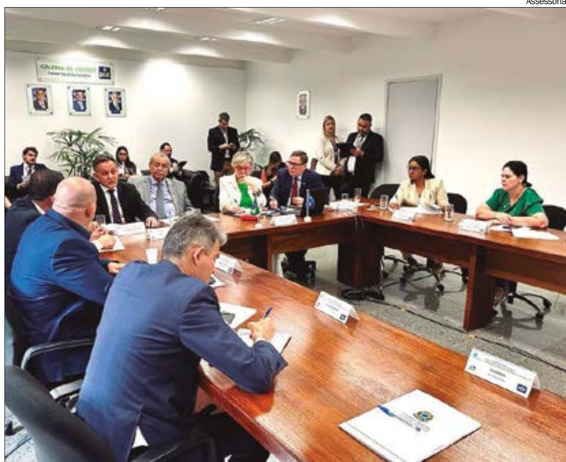
Senadores de MT pretendem contestar estudo da Funai, mas também trabalham em um decreto legislativo para suspender demarcação

"Eu tenho uma vida inteira de trabalho honesto e me sinto derrotado. Quando adquirimos um imóvel, buscamos segurança jurídica, e de repente surge um