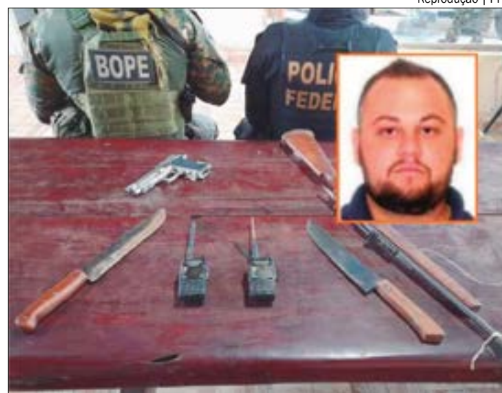
A trama foi denunciada anonimamente às Polícias Civil e Federal. Diante disso, uma força tarefa foi montada