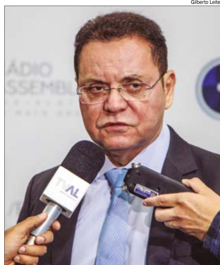
Expectativa de Botelho é que STF mantenha entendimento de outras ações que questionavam as Mesas Diretoras de outros estados

O documento cita que “os membros da Mesa e seus respectivos substitutos serão eleitos para mandato de 2 (dois) anos, vedada a recondução para o mesmo cargo na eleição imediatamente subsequente”.