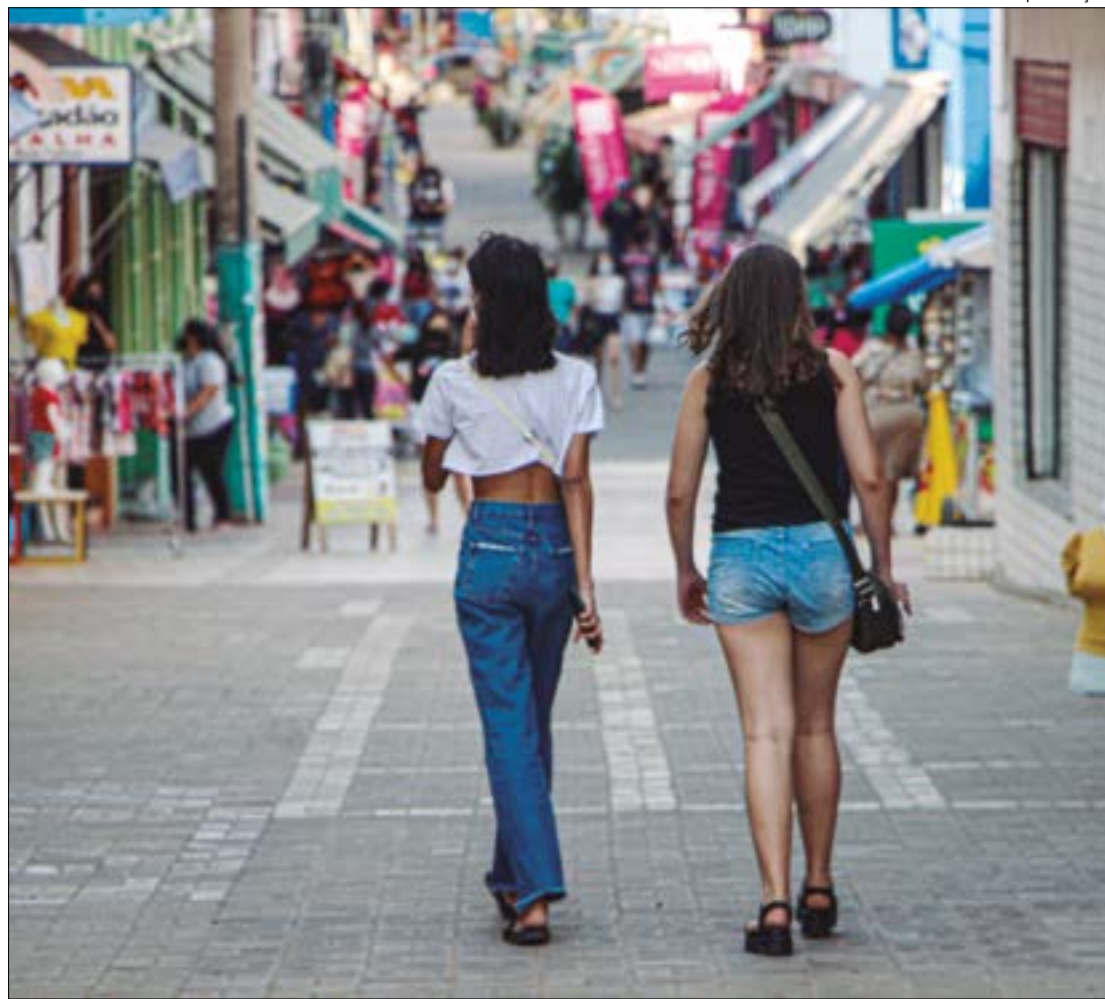
Gilberto Leite | Ilustração

O desejo do pai é o grande destaque para as compras com o percentual de 69,8%, seguido pela qualidade do produto, serviço e marca (10,4%). Em relação ao presente que irão comprar, os que estão na preferência são: Vestuário e Acessórios Masculino (38,3%); perfumes (25,8%); calçados (12,5%); joias/relogios (7,0%); artigos esportivos (5,2%); telefonia/smartphone (2,8%); alimentos e bebidas (2,4%); eletrônicos (2,1%), livros/livraria (1,1%) e outros (2,8%).